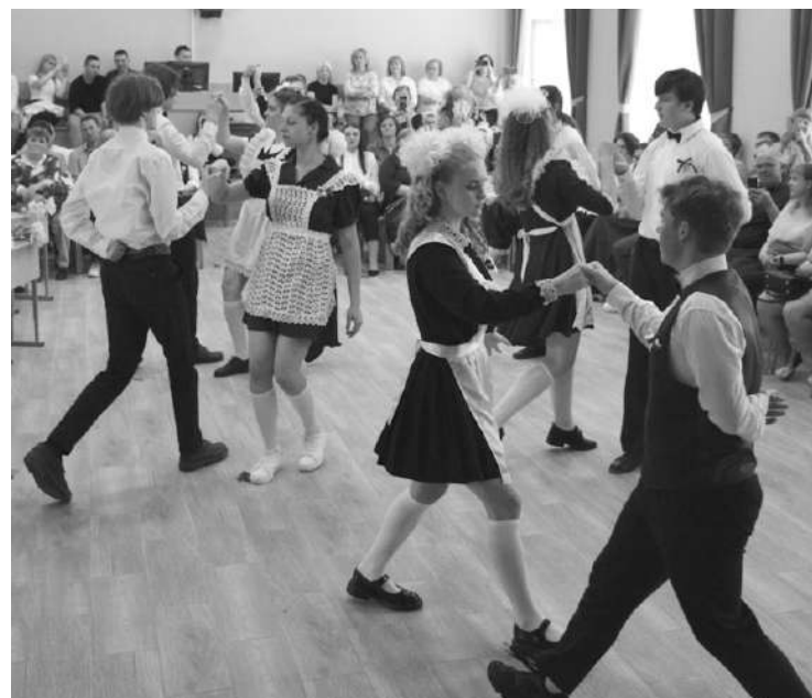
● Школьный вальс