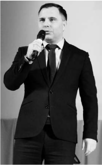
В честь года семьи в России и года заботы в Ленинградской области в ГДЦ «Родник» отгремел патриотический концерт «Россия — это мы».

Перед концертом состоялась благотворительная акция: каждый мог поучаствовать или в сборе средств для нужд СВО, или в изготовлении блиндажных свечей и сухого армейского душа, так необхо-