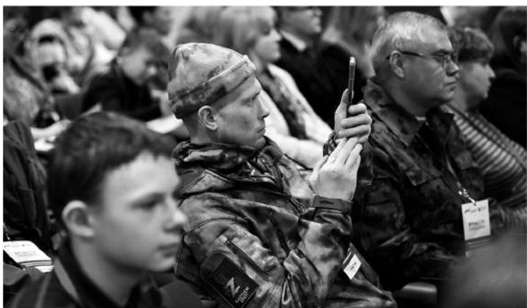
Участие в форуме приняли ветераны СВО, военные корреспонденты и волонтеры