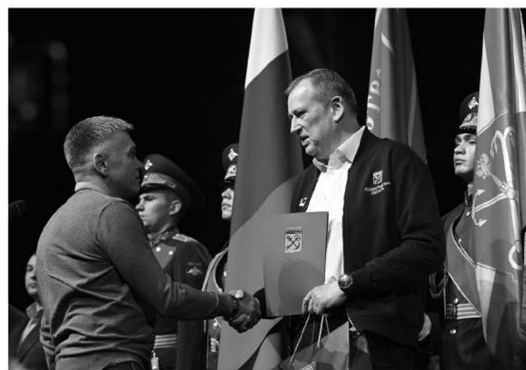
Александр Дрозденко наградил участников боевых действий и восстановления Донбасса