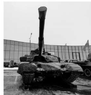
Гостей ждала выставка боевой техники

Центральным событием фестиваля стал первый региональный форум «Вместе победим». Его участниками стали ветераны СВО и родственники бойцов.