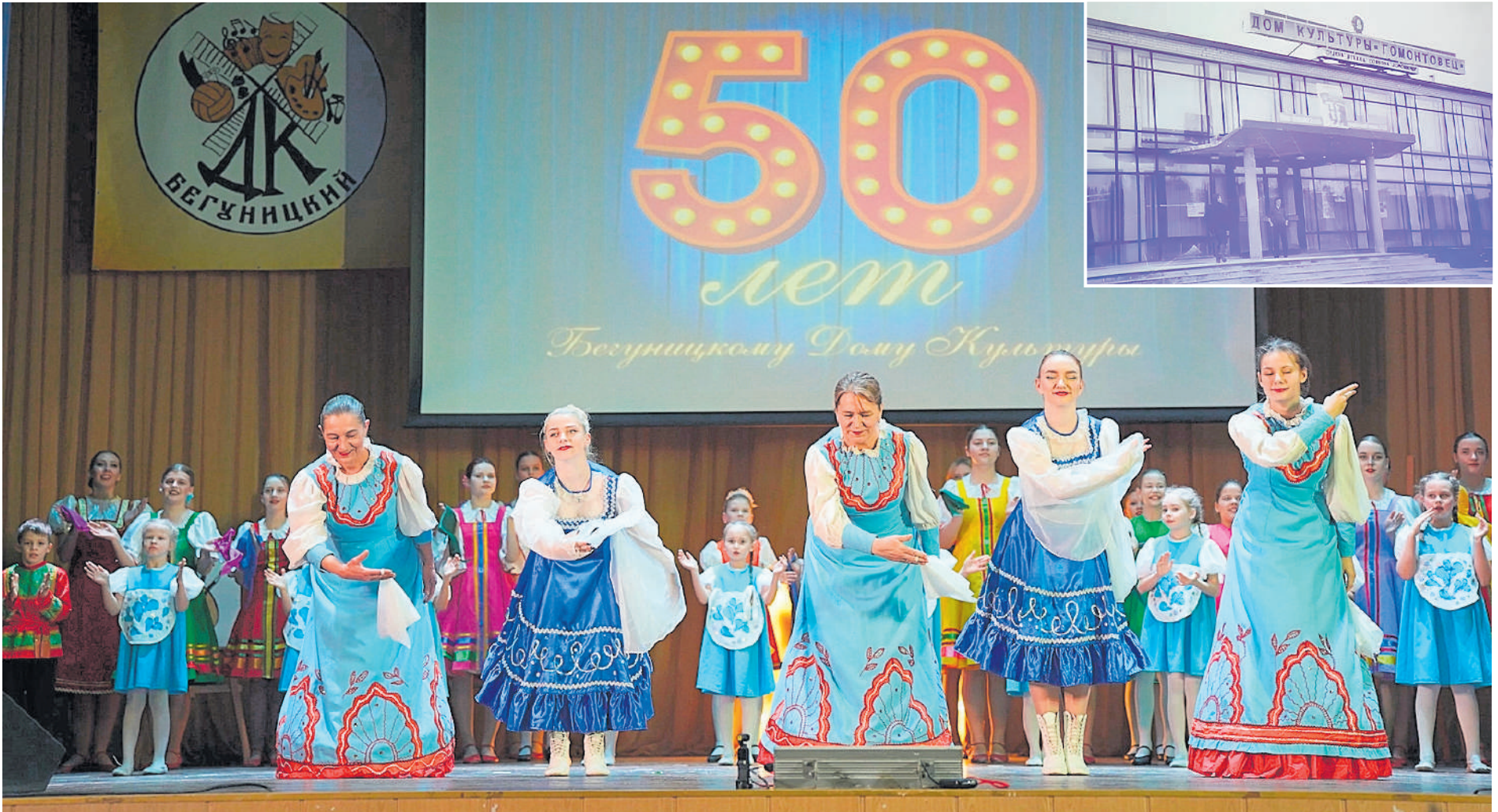
● Фото С. Холодного

Вот уже 50 лет Дом культуры в Бегуницах живет и дышит творчеством, постоянно находится в центре событий, идет в ногу со временем. Подробнее на 2-й стр.