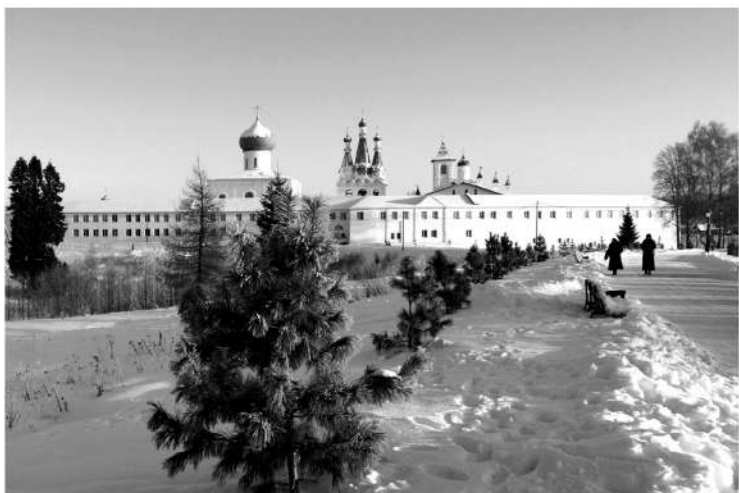
Свято-Троицкий Александро-Свирский монастырь основан в XV веке

Областное правительство поддержало идею нового туристического маршрута, который объединит сразу 8 святынь Ленинградской земли. Специалисты считают, что двухдневный тур будет интересен не только паломникам, но и тем, кто интересуется родной историей и природными достопримечательностями.