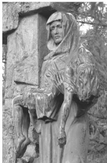
Памятник «Детям Беслана» в Малоохтинском парке

– Каждый год мы вместе с петербуржцами и жителями области возлагаем цветы у подножия памятника Детям Беслана в храме Успения Пресвятой Богородицы на Малоохтинском проспекте. Там же служим литургию. В этом году также приглашаем присоеди-