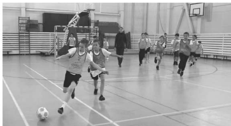
Игроки ФК «Ленинградец» научили школьников приёмам из большого футбола

По традиции всё начинается с разминки и теоретической части. Как правильно разогреться перед игрой? Как остановить мяч в два касания? Советы ма-