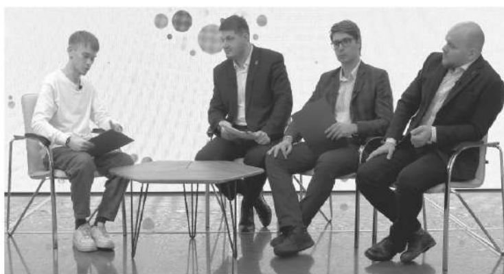
Неделя профилактических мероприятий объединила в себе круглые столы и социальные рейды в защиту подростков

Одним из главных мероприятий цикла стал круглый стол на тему профилактики экстремизма, прошедший в областном Доме дружбы. Здесь собрались более 100 человек, в первую очередь – представители системы образования. Вместе они