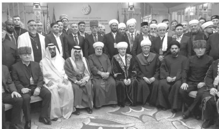
Участники конференции «Традиционные религия за сильную Россию»

Не удивительно, что Ленинградская область активно включилась в празднование 1100-летия принятия ислама Волжской