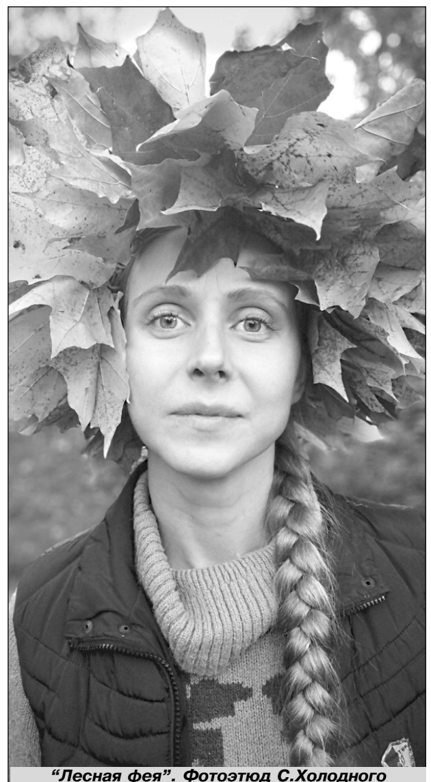
"Лесная фея". Фотоэтиюд С.Холодного

Материалы страницы подготовила Н. БОГДАНОВА