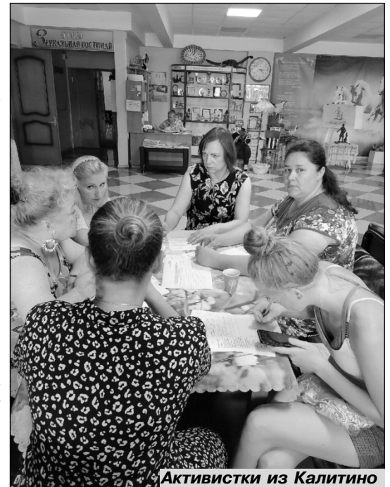
Активистки из Калитино

• Женсовет д. Б. Вруда оказал благотворительную помощь Центру помощи беременным женщинам, оказавшимся в трудной жизненной ситуации, "Две полоски";