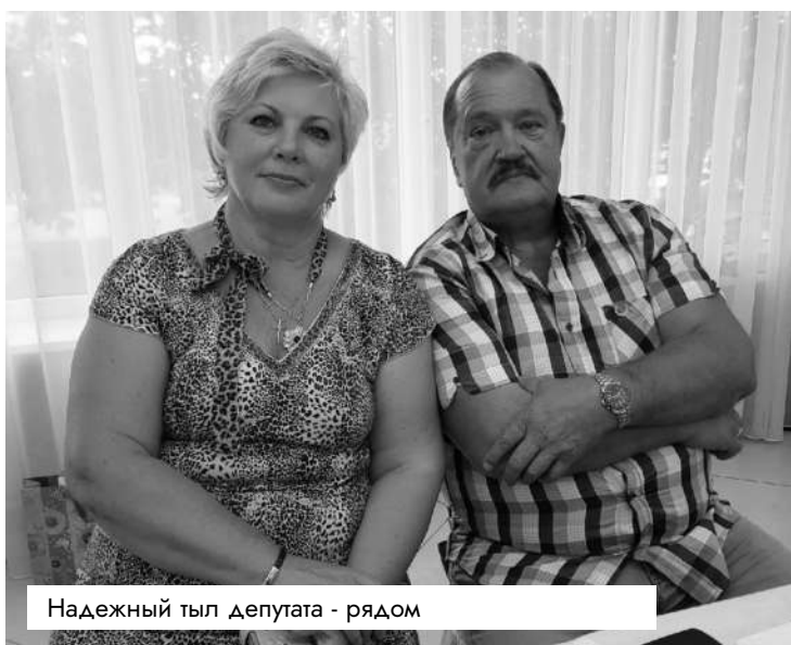
Надежный тыл депутата - рядом