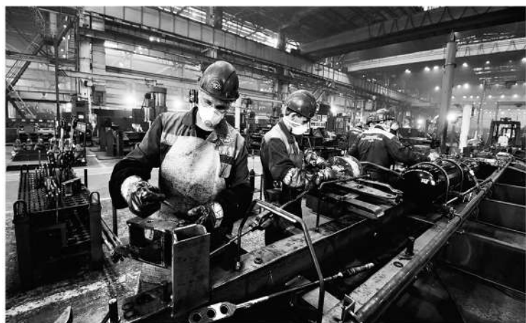
Безработица в регионе стремится к нулю, предприятиям нужны квалифицированные специалисты

— Вообще-то я считаю, что Ленинградская область обре-