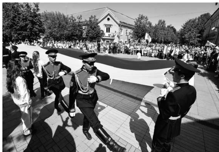
Патриотизм и взаимоподдержка объединяют ленинградскую семью

— Мы провели очень важное мероприятие для России — съезд молодых учителей со всей страны. Этот съезд проходил в Гатчине уже в четвёртый раз, и все воспринимают его как наше, ленинградское событие. Отмечу работу со школами — в них появляются IT-клубы, кванториумы, образование становится более цифровым и современным. В регионе активно открываются молодёжные