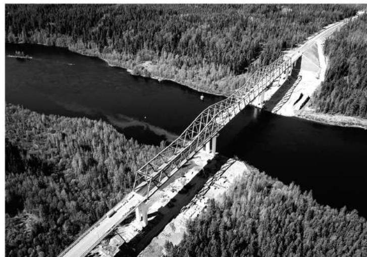
Строительство моста через реку Свирь стало историческим событием

Классификация книг такая: во-первых, всегда в ходу что-то лёгкое, например, детектив или авантюрный роман. Во-вторых, обязательно читаю какой-нибудь исторический труд. Недавно, например, в оригинале прочитал труды Ломоносова, сейчас читаю много об истории российской государственности — целыми сериями книг. В-третьих, люблю научно-популярные книги — будь то социология, культура или даже физика. Стараюсь изучать эти темы глубоко: ино-