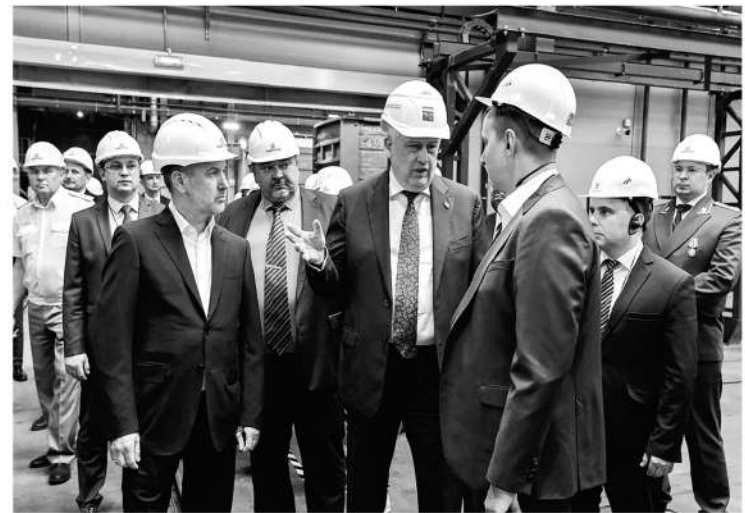
Ленинградская промышленность наращивает обороты несмотря на санкции

— Мы, наверное, единственный регион, где уже работают три отделения федерального фонда «Защитники Отечества» — во Всеволожске, Выборге и Гатчине. Скоро будем открывать ещё один — либо в Луге, либо