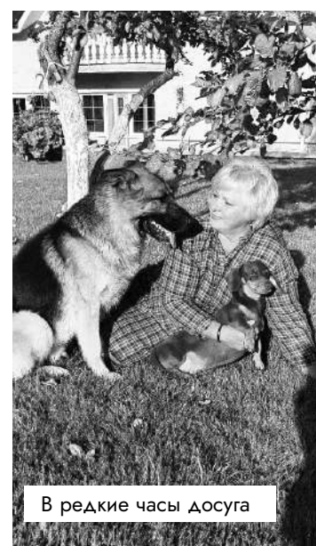
В редкие часы досуга

Люди все достойные, все переживают в хорошем смысле за свою работу, за регион и за свой район. Радует, что депутатский корпус пополняет интересная молодежь.