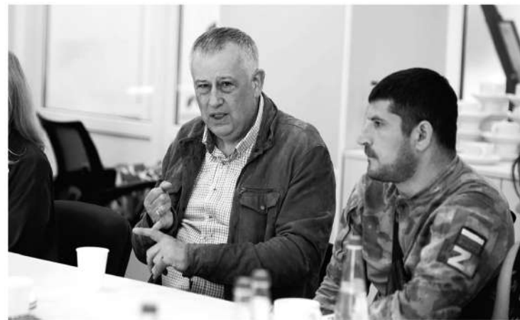
Александр Дрозденко на встрече с участниками и ветеранами СВО

в перспективе вижу в привлечении ветеранов к воспитательной и патриотической работе — ждём их в качестве преподавателей в наших центрах «Авангард» и «Молодёжный». Не обязательно учить мелодию именно военному делу — просто воспитывать их патриотами, рассказывать об истории и культуре, прививать любовь к спорту.