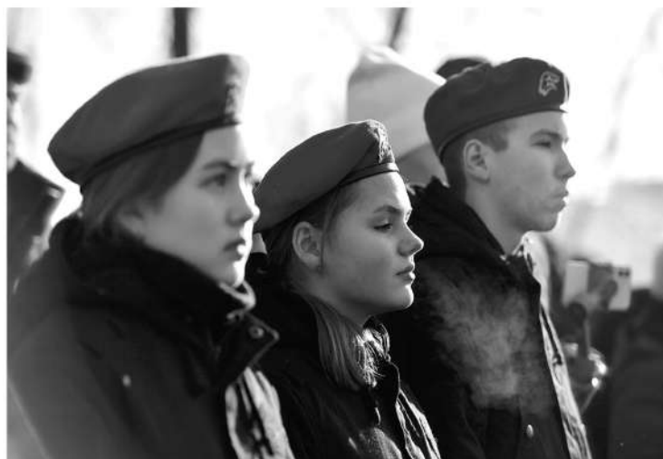
В регионе открываются новые центры военно-патриотического воспитания