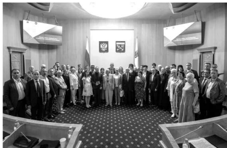
Участники Совета при губернаторе Ленинградской области по межнациональным отношениям

ЛЕНИНГРАДЦЫ РАЗНЫХ НАЦИОНАЛЬНОСТЕЙ И РЕЛИГИЙ ОБЪЕДИНИЛИСЬ, ЧТОБЫ ПОДДЕРЖАТЬ РЕШЕНИЯ ПРЕЗИДЕНТА