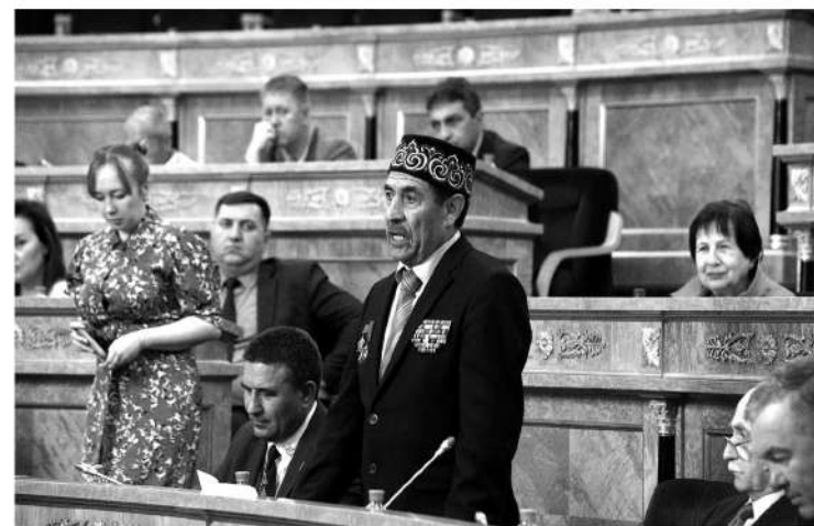
На заседании выступили представители национальных общин и религиозных организаций региона