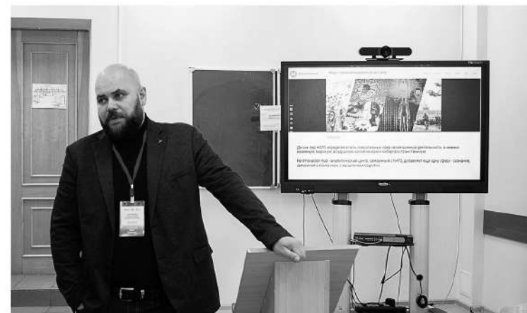
Опытные эксперты рассказали ребятам об угрозе кибертерроризма