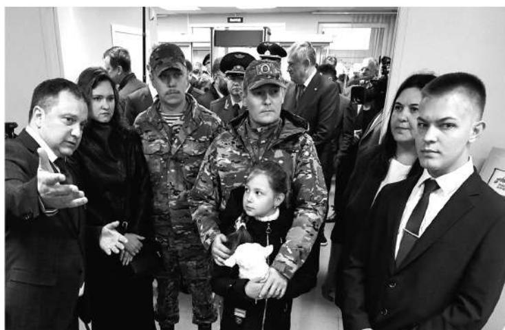
В центрах филиала ждут как военнослужащих, так и членов их семей

То самое поручение Владимир Путин озвучил в Послании Федеральному собранию в конце февраля. А уже к началу лета Ленинградская область была готова его полностью выполнить. Выборгский центр «Защитники Отечества» стал одним из первых пяти филиалов Государственного фонда поддержки участников специ-