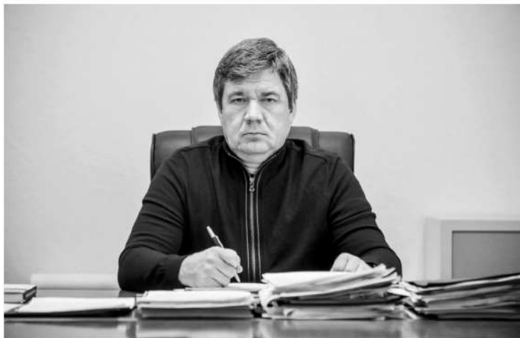
Михаил Ильин, вице-губернатор Ленинградской области по безопасности

Расширяется и список льгот для всех военнослужащих в зоне СВО: на данный момент в Ленобласти действуют 52 меры поддержки наших защитников. Это больше, чем в других регионах Российской Федерации. Кроме того, по решению губернатора на областные выплаты теперь могут рассчитывать и бой-