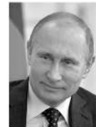
ВЛАДИМИР ПУТИН, ПРЕЗИДЕНТ РОССИЙСКОЙ ФЕДЕРАЦИИ

Работа фонда «Защитники Отечества» должна быть открытой, а сам порядок оказания помощи — простым, без казённости и бюрократии. За каждой семьёй, за каждым ветераном должен быть закреплён свой персональный социальный работник, координатор, который в ходе личного общения в режиме реального времени будет решать возникающие вопросы. Уже в этом году структуры фонда должны быть развернуты во всех регионах Российской Федерации.