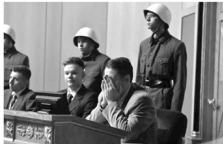
На скамье подсудимых оказались 24 обвиняемых

— Нюрнбергский процесс остаётся главным судом над нацистами, он касается и преступлений, совершённых на нашей земле. Три фронта — Ленинградский, Волховский, Карельский, более 1140 дней шли бои на территории нашей родной Ленинградской области, почти 900 дней