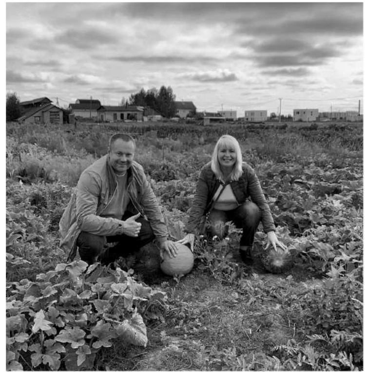
Новый глава организации и сам занимается садоводством

— Нам очень важно, чтобы все садоводства «от А до Я» вошли в наш союз. Представьте себе: если газификацию просит конкретное СНТ — это одно де-