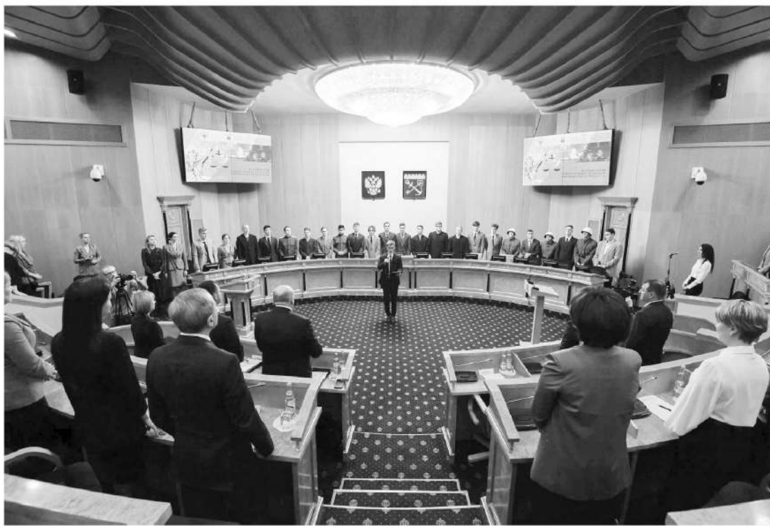
Будущие юристы посвятили документальную постановку всем жертвам нацизма