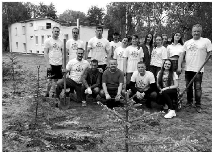
Активисты Союза высадили зелёную изгородь на территории детского хосписа

— Времена изменились — сегодня мы говорим уже не о выживании, а о развитии. Государство действительно заботится о дачниках и садоводах, оказывается серьёзная помощь. Можно вспомнить выделение 1 миллиарда 300 миллионов рублей на ремонт дорог, прилегающих к садоводствам. Это то, чего люди действительно ждут.