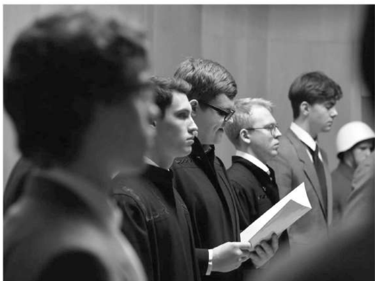
Судебный процесс в Нюрнберге длился на протяжении 10 месяцев