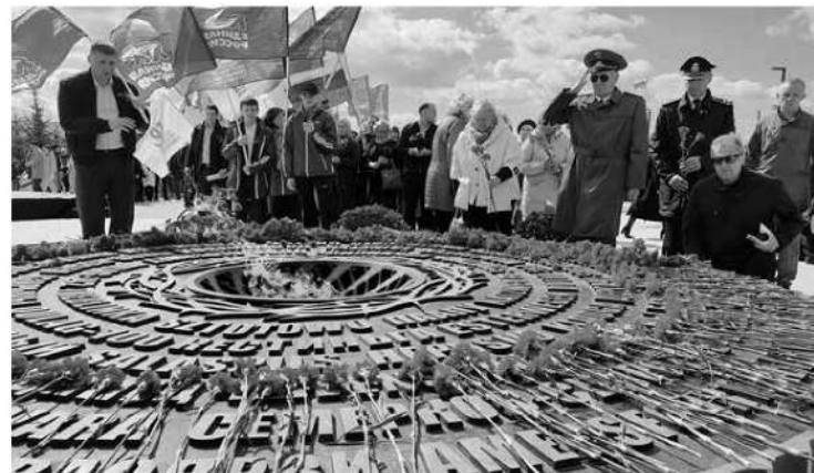
Участники акции почтили память мирных жителей, ставших жертвами фашистского геноцида

— Важно, что специалисты из других регионов, которые приезжают к нам, отлично взаимодействуют с местными поисковиками. Работа идёт бок о бок. Это позволяет нам ежегодно поднимать тысячи бойцов и командиров Красной армии, кото-