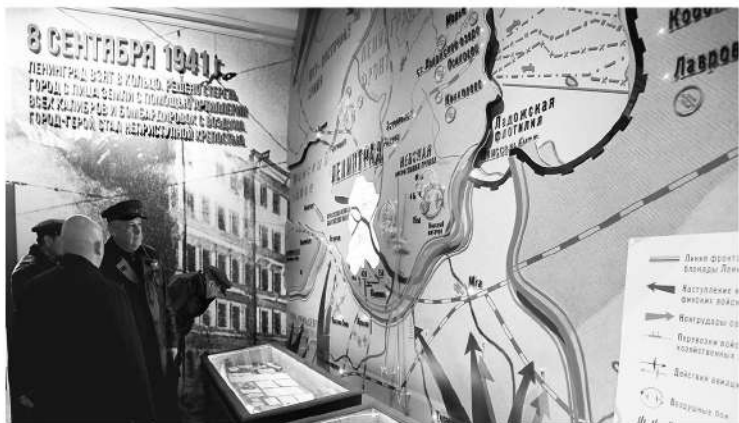
Ленинградская область бережно хранит память о Дороге жизни

ЛЮДМИЛА КОНДРАШОВА