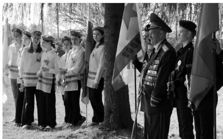
Аллея памяти военных журналистов становится новым местом притяжения для жителей Любани