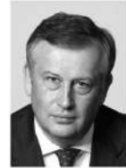
АЛЕКСАНДР ДРОЗДЕНКО, ГУБЕРНАТОР ЛЕНИНГРАДСКОЙ ОБЛАСТИ

Я благодарен Владимиру Владимировичу Путину за твердую поддержку нашей инициативы о комплексной модернизации Дороги жизни. Теперь наша задача — выполнить поручение президента. Мы должны сделать «Дорогу жизни» современным мемориальным объектом, достойным поколения внуков и правнуков тех, кто одержал великую Победу, кто отстоял Ленинград, кто освободил Ленинградскую область