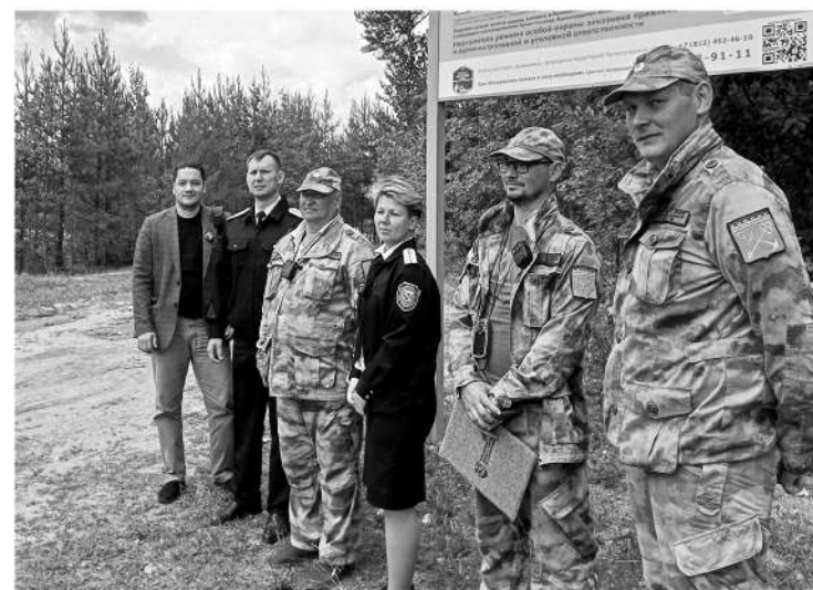
Госэконадзор регулярно проводит рейды на территории особо охраняемых природных зон

Услышав о полиции, компания присмирела. Одна из девушек подошла, извинилась и пообещала в скором времени удалиться восвояси. Всё-таки никому не нужны серьёзные проблемы с законом.