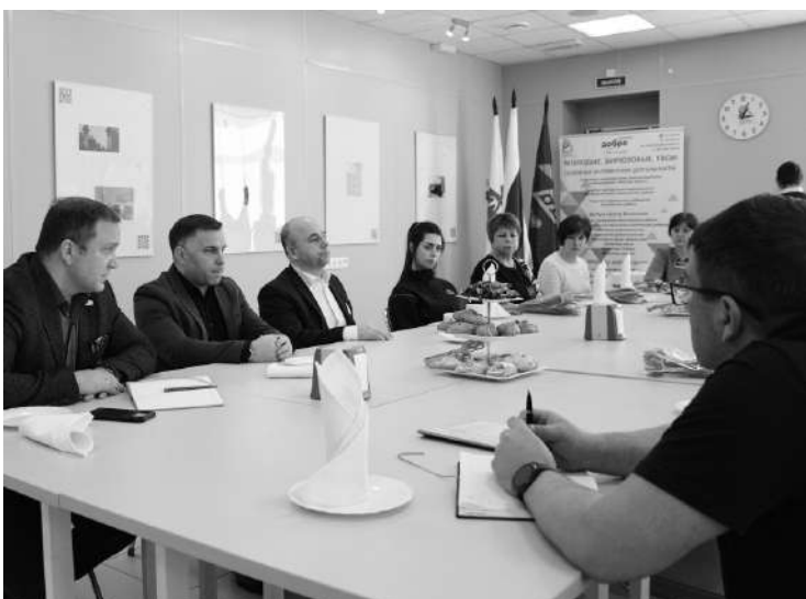
Материалы страницы подготовила Н. БОГДАНОВА

Непростая встреча состоялась в Молодежном центре «Бирюзовый»: руководители района, представители комитета социальной защиты населения и филиала фонда «Защитники Отечества» Ленинградской области пригласили членов семей погибших бойцов СВО для неформального общения за чашкой чая.