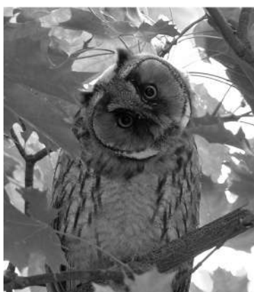
Ушастая сова в ленинградском лесу