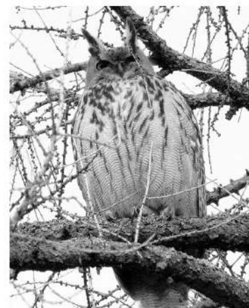
Филин — самая крупная сова в Ленобласти

У другой нашей совы «уши» из удлинённых перьев куда более заметны. За них она и получила своё видовое название: ушастая. Напомню: настоящие уши у сов — это два длинных отверстия по бокам головы, полностью скрытые под оперением. Величиной ушастая сова — с ворону. В окрасе её преобладают сероватые, рыжеватые и желтовато-бурые тона. Из всех сов нашего региона только у неё и у филина глаза — оранжевого цвета. Ушастая сова, как и болотная, в холодное время года улетает зимовать на юг.