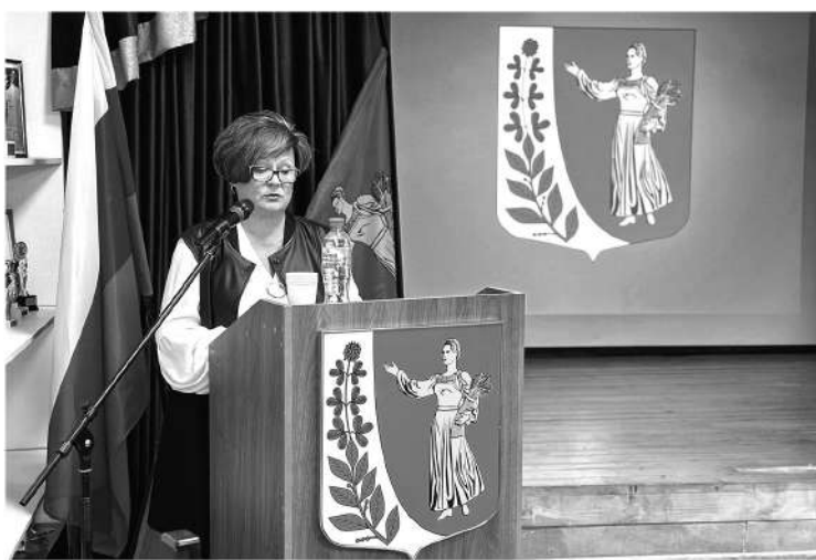
Представители местной власти отчитываются об итогах работы в 2024 году

В поселениях Ленинградской области с января проходят традиционные отчётные собрания. Главы муниципальных образований делятся достижениями за 2023 год, рассказывают о рабочих планах и отвечают на вопросы местных жителей.