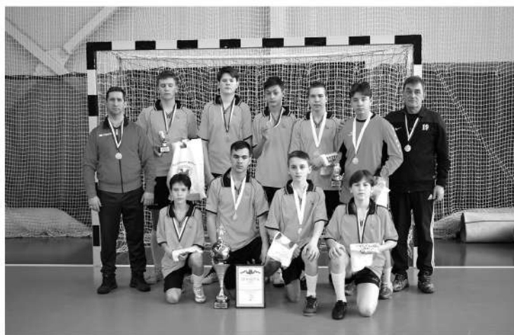
В турнире победила команда Толмачёвского ресурсного центра