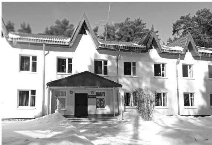
Даже зимой в Центре «Молодёжный» вовсю кипит жизнь

Деревня Кошкино во Всеволожском районе на несколько дней стала местом притяжения для юных и активных ленинградцев. Именно здесь, на берегу Ладожского озера, в окружении сосновых лесов прошёл региональный Слёт Российского союза молодёжи.