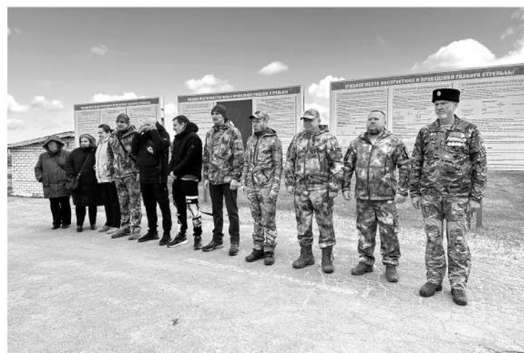
Заслуженные награды получили ветераны СВО и сотрудницы областного военкомата

Вместе с участниками инспекции мы заходим внутрь этой бетонной громады, осматриваемся. Перед нами — отреставрированные помещения, исторические орудия, бойницы... Действительно, внутри столь мощной постройки ты буквально