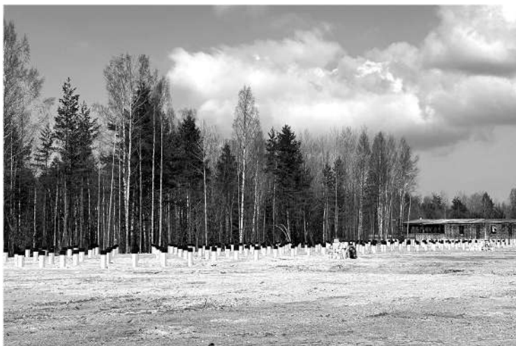
Совсем скоро здесь появятся казармы, банный комплекс и учебный центр

АЛЕКСАНДРА РОДИОНОВА