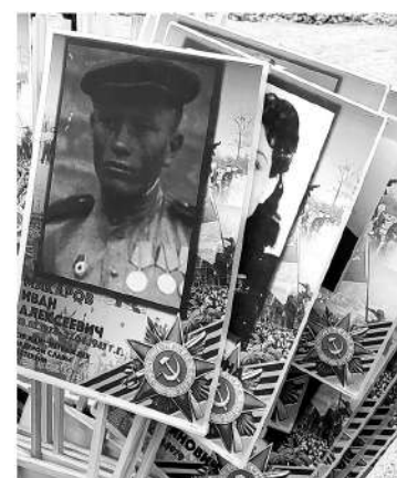
Люди приносили на концерт портреты ветеранов

Самых жителей Ивангорода и гостей митинга-концерта ещё до начала торжества встречала выставка военной техники и полевая кухня. По сравнению