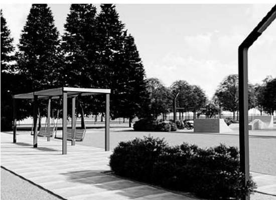
● Благоустройство в Зимитицах

Работы пройдут по федеральному проекту «Формирование комфортной городской среды» нацпроекта «Жилье и городская среда», инициированного президентом России Владимиром Путиным [47]