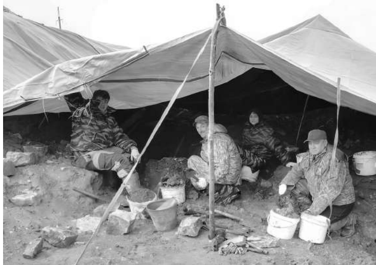
На раскопе в Захонье