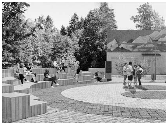
● Благоустройство в Изваре

Материалы страницы подготовила Н. БОГДАНОВА