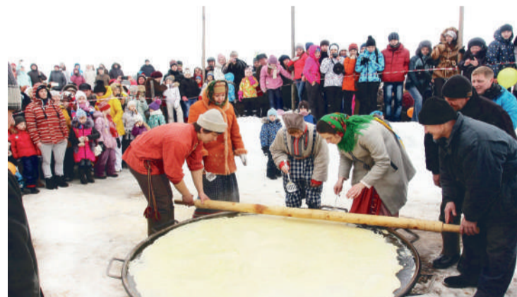
● А вам слабо? (Масленица в Вологде. Фото с сайта cultinfo.ru )

В Ялutorовске Тюменской области в 2022 году испекли самый большой блин в России – почти