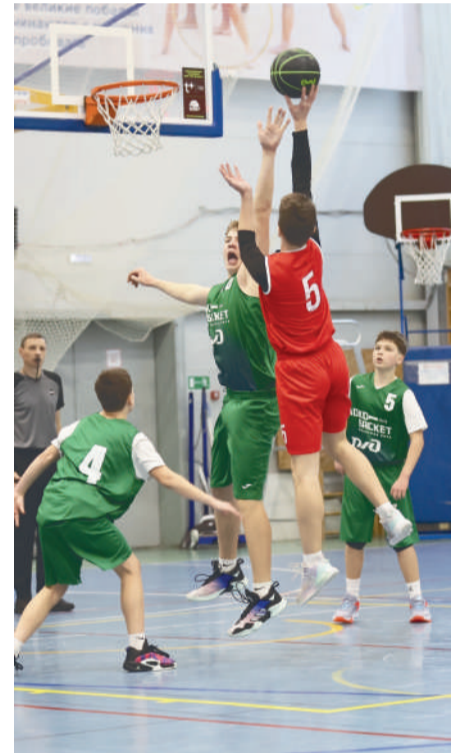
● Наши - в зеленой форме

Команды-победители отправятся на финал чемпионата школьной баскетбольной лиги «Локобаскет», кото-