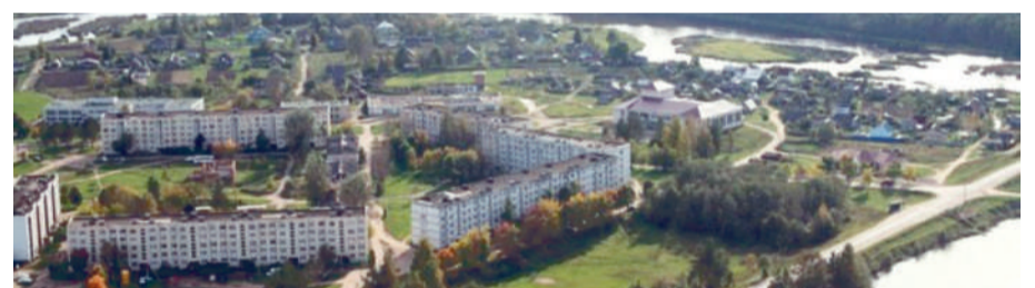
● Б. Сабск

Полезные навыки приобрели ребята на практических занятиях по использованию средств индивидуальной защиты дыхания и мастер-классах для учащихся 8-10 классов по неполной разборке и сборке АК-74 [47]