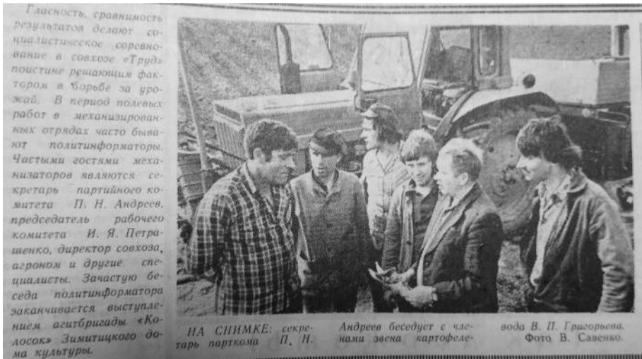
«СН» от 14 июня 1979 года

Большие перемены произошли в хозяйстве за период после XXV съезда КПСС. Еще более расширил свои границы, преобразился посе-