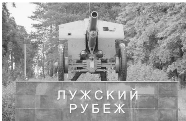
● Лужский рубеж