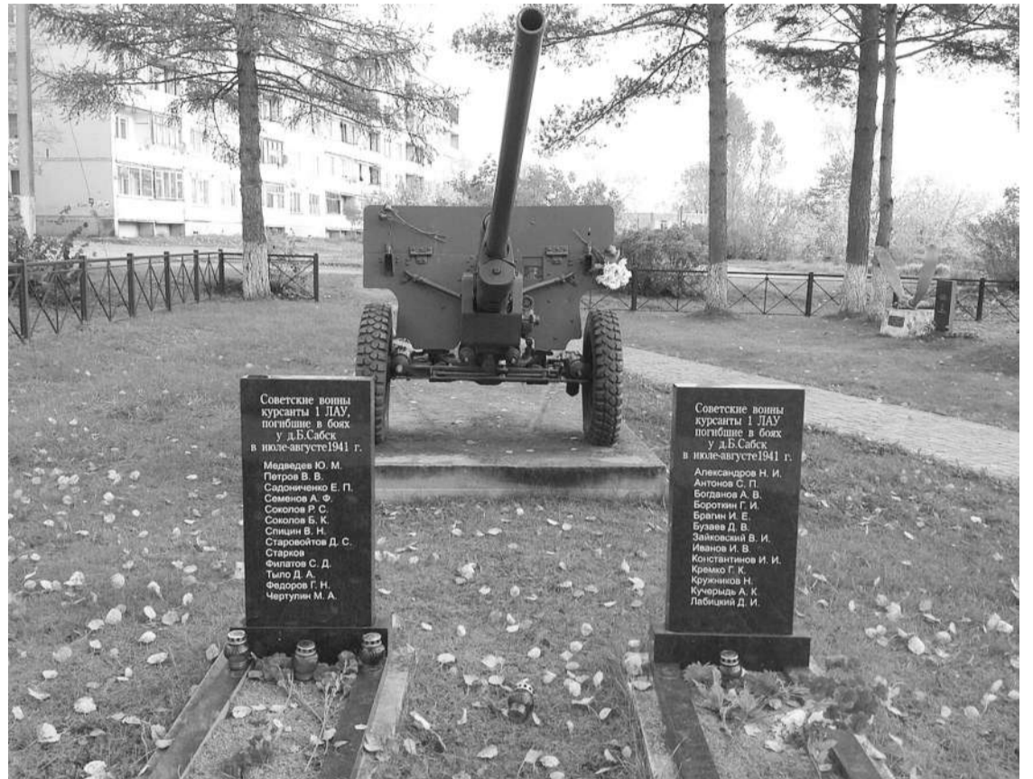
● На мемориале в Б.Сабске

14 июля дивизион убыл на юго-запад от Ленинграда. В этот же день он прибыл в город Красногвардейск, где влился в состав 94-го противотанкового артиллерийского полка и получил боевой приказ: прибыть в район с. Извоз и поступить в распоряже-