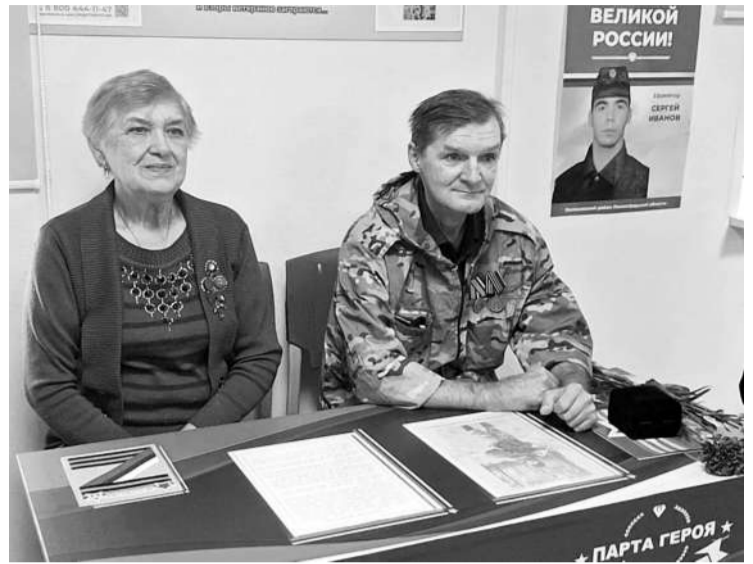
● С мамой на открытии парты героя

Куда бы мы ни обращались, везде охотно принимают, выслушивают и подсказывают. Это и администрация района, и депутат Законодательного собрания Ленинградской обла-