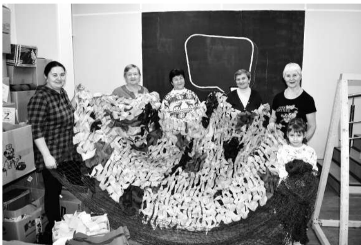
● Объединение «Тепляночки» - фронту

ка всего общества, которое ценит их усилия и жертвы. Это наша с вами ответственность - обеспечить военным и их семьям не только материальную, но и моральную поддержку.