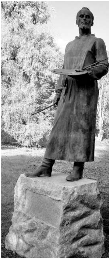
● Памятник Рериху в Изваре

Кроме того, в отчётном году были начаты работы, чтобы наконец-то завершить строительство дома культуры на 150 мест в деревне Терпилицы, которое было начато 10 лет назад. После долгого перерыва предстоит выполнить значительный объём работ: от демонтажа некоторых элементов до полного приведения здания в готовность и благоустройства прилегающей территории. Планируется, что уже в 2026 году дом культуры будет введён в эксплуатацию, предоставив жителям современное пространство для творчества, общения и проведения мероприятий.