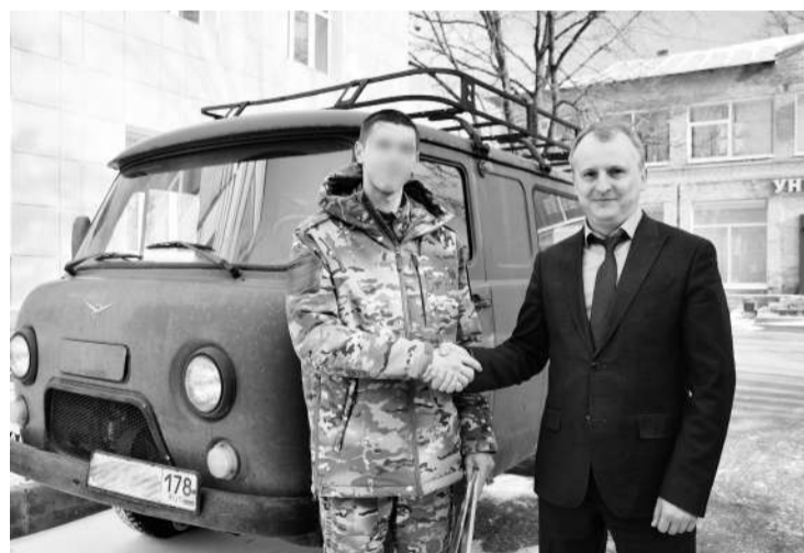
● Передача автомобиля военнослужащим

Напомню, что государство обеспечивает наших защитников