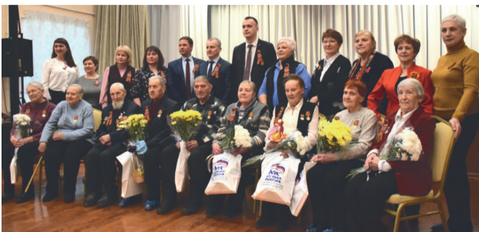
● Все участники торжественной церемонии в Волосовской школе искусств

В нашем районе, как и по всей стране, проходят торжественные церемонии вручения юбилейных медалей «80 лет Победы в Великой Отечественной войне 1941-1945 гг.». Указ об утверждении этой высокой памятной награды подписал президент Российской Федерации Владимир Владимирович Путин как знак глубокого уважения героическому подвигу ветеранов войны, тружеников тыла и всех, кто внёс свой вклад в разгром фашистской Германии.