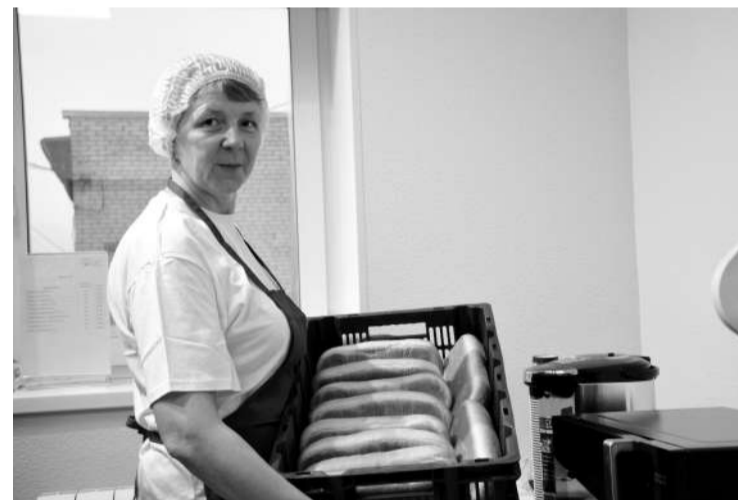
● Открытие пекарни райпо

В отчётном году мы добились значительного результата – утверждён генеральный план Клопицкого поселения. Работа над ним велась целых 4 года, начиная с момента объединения поселений в 2019 году. В текущем году начнётся разработка Правил землепользования и застройки поселения, которая будет проводиться в два этапа. Первый этап охватит территории коттеджных посёлков Новосельцево-1 и Новосельцево-2, а также садоводства «Греческое», где наблюдается активная жилая застройка. Второй этап затронет оставшуюся территорию Клопицкого поселения.