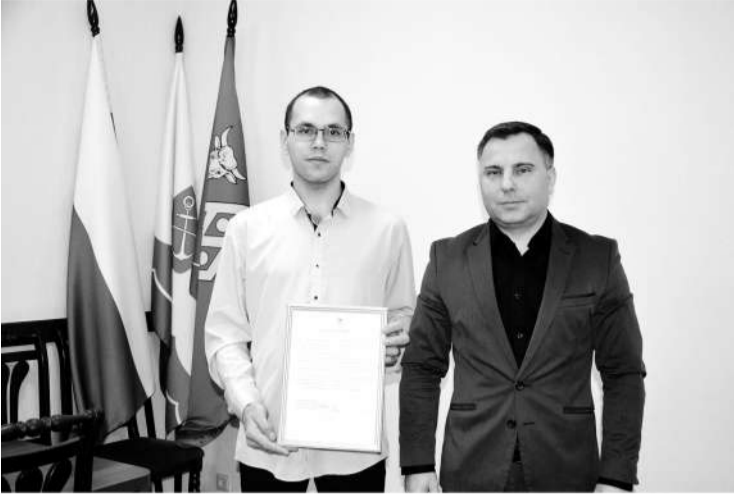
● Вручение земельного сертификата бойцу СВО

Ещё 20 военнослужащим, заключившим контракт, были выданы земельные сертификаты. Они могут воспользоваться ими двумя способами: либо во внеочередном порядке получить земельный участок в любом районе Ленинградской области, либо заменить сертификат на единовременную денежную выплату, которая ежегодно индексируется и по состоянию на начало текущего года и составляет почти 420 тысяч рублей.