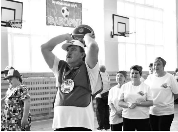
● Спартакиада ветеранов

В 2024 году после обучения вернулся работать в больницу 1 «целевик» - специалист, который в 2018 году заключил договор о целевом обучении по специальности «педиатрия». С сентября он работает в Бегуницкой амбулатории участковым врачом-педиатром.