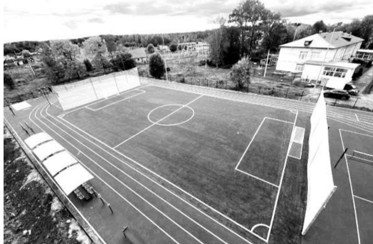
● Новая спортплощадка в Изваре

В 2025 году планируется завершить капитальный ремонт первого этажа здания стационара (включая приёмное и эндоскопическое отделения) и присту-