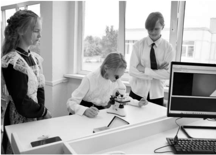
● В центре «Точка роста» Сабской школы

Для того чтобы сделать ведущие образовательные технологии доступнее, в районе была успешно реализована программа по созданию центров образования «Точка роста». С 1 сентября 2024 года начали работу ещё 4 таких центра. Они открыты на базе Кикеринской, Бегуницкой, Октябрьской и Сабской школ. На их создание в прошлом году было направлено почти 12 млн рублей. Таким образом, проект завершён, и теперь в районе функционирует 11 центров «Точка роста».