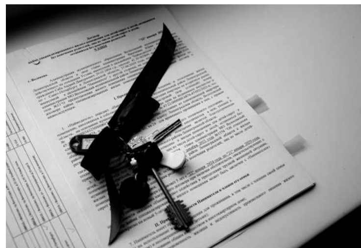
● Ключи от квартиры. Обеспечение жильём детей-сирот и детей, оставшихся без попечения родителей.

Важно отметить, что в Волосовском районе приезжим медикам предоставляется служебное жильё, что является серьёзным преимуществом. В отчётном году было приобретено ещё 2 квартиры для медицинских работников первичного звена.