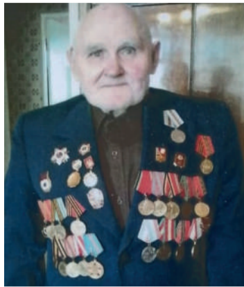
● Лавров Борис Степанович