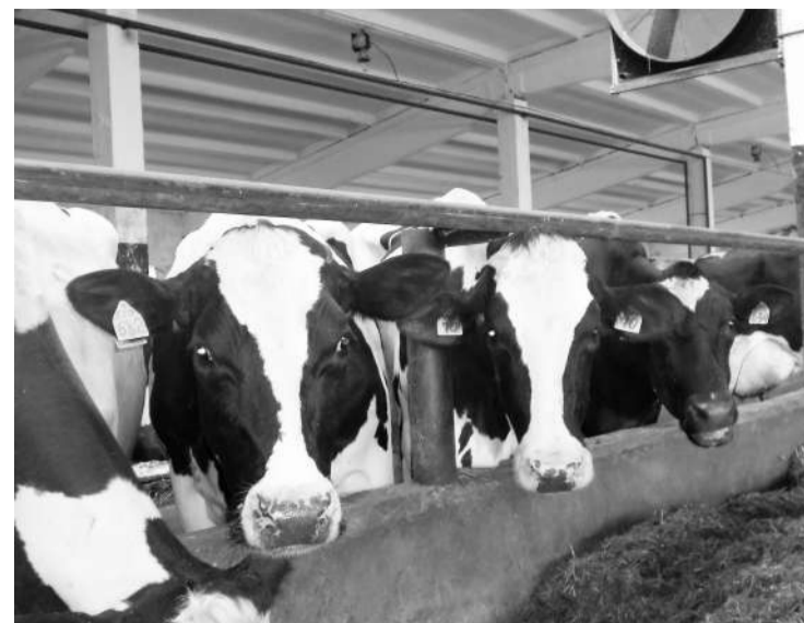
● На ферме

2024 год стал для аграриев района далеко не самым худшим. Район продолжает занимать лидирую-