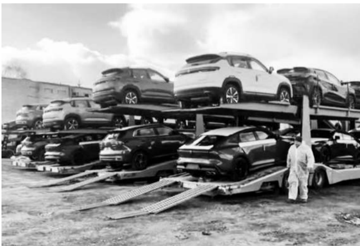
● Канавара, 81 км

В отчётном году мы вместе прошли через сложные испытания и впереди у нас ещё есть нерешённые вопросы. Но мы работаем одной большой командой, с полным взаимопониманием, с чувством своей ответственности перед людьми, что вселяет уверенность в достижении намеченных целей.