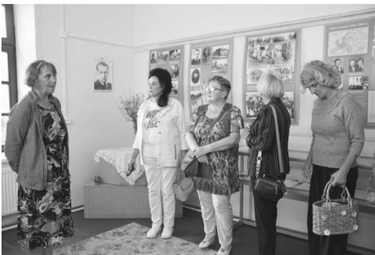
● В музее Б.Вильде

Развитие инфраструктуры и создание комфортных условий для жителей и гостей района –