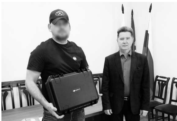
● Передача БПЛА военным

ЗА 2024 ГОД АДМИНИСТРАЦИЕЙ ВОЛОСОВСКОГО РАЙОНА БЫЛ ПРЕДОСТАВЛЕН 31 ЗЕМЕЛЬНЫЙ УЧАСТОК ВETERANAM БОЕВЫХ ДЕЙСТВИЙ. ПРИ ЭТОМ В КОНЦЕ 2024 ГОДА 11 ВETERANOV ПОЛУЧИЛИ УЧАСТКИ В СОБСТВЕННОСТЬ СРАЗУ И ЕЩЕ 5 ВETERANOV УСПЕШНО ПЕРЕОФОРМИЛИ СВОИ УЧАСТКИ ИЗ АРЕНДЫ В СОБСТВЕННОСТЬ.