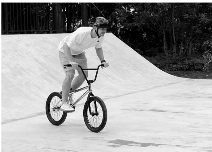
● Скейт-площадка в г. Волосово

Этот механизм позволяет вернуть в оборот земли, которые десятилетиями зарастали древесно-кустарниковой растительностью и борщевиком Сосновского. Теперь у нас есть инструмент для решения этой проблемы. Однако мы понимаем, что работы предстоит очень много, особенно учитывая необходимость определения границ земельных участков в координатах для их регистрации.