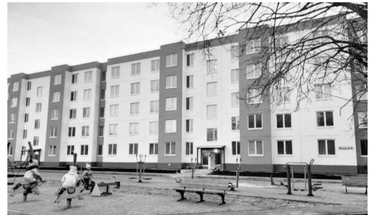
● Дома и улицы

В отчётном году особое внимание было уделено муниципальной дорожной сети Сабского поселения. Здесь начались работы по реконструкции двух дорог Лемовжа – Гостятино и Большой Сабск – Изори. Раньше это были грунтовые дороги, которые каждую весну становились практически непроходимыми. После завершения работ в 2026 году дороги обретут твёрдое покрытие из щебня, станут устойчивыми к сезонным изменениям и более безопасными для всех, кто ими пользуется.