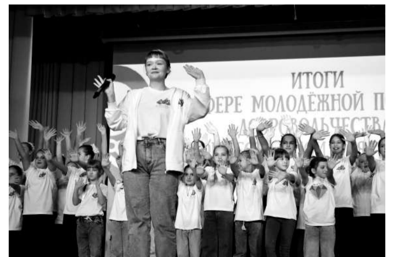
● Активная молодёжь

Продолжая тему развития культурной инфраструктуры, необходимо сказать, что в отчётном году было продолжено обновление материально-технической базы домов культуры. В деревне Рабетицы начат капитальный ремонт ДК, в рамках которого будет отремонтирован фасад, все внутренние помещения, а также заменены инженерные системы, включая вентиляцию, водоснабжение, отопление, канализацию, освещение и систему охраны. Особое внимание будет уделено сцене, которую оснастят современным оборудованием, что позволит проводить мероприятия на качественно новом уровне.