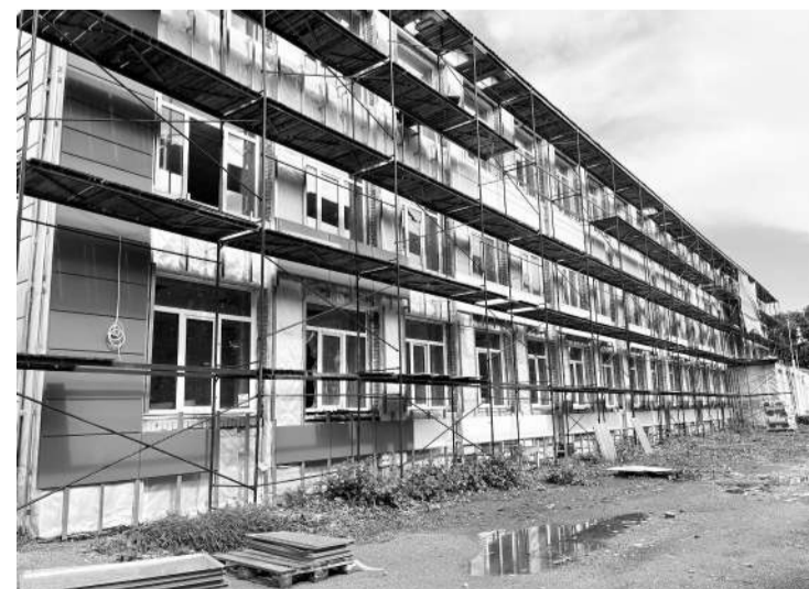
● Капитальный ремонт Яблоницкой школы

Однако по земельному налогу ситуация сложилась иная. В отчётном году в результате переоценки значительно снизилась кадастровая стоимость земельных участков, используемых в коммерческой деятельности. По некоторым участкам стоимость уменьшилась в 2–3 раза. Это привело к снижению поступлений по земельному налогу. Тем