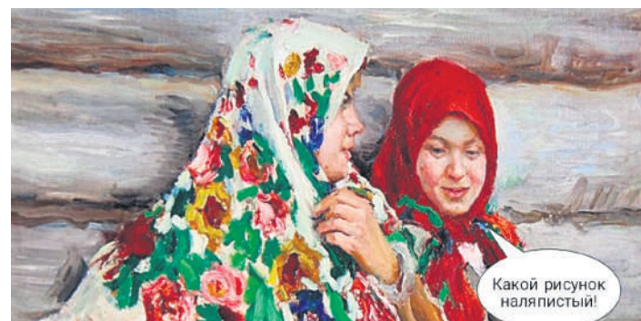
Какой рисунок наляпистый!

Калужницы получили свое название от старого русского слова «калуга», что означало придорожную яму с водой. Они действительно растут в воде, предпочитают ручьи с тальми водами и небольшие лесные речушки. Но мало кто знает, что при обеспечении их поливом калужницы неплохо себя чувствуют под сенью больших деревьев на богатых почвах. Это прекрасные теневые растения. В садах же их чаще можно увидеть в небольших декоративных водоемах.