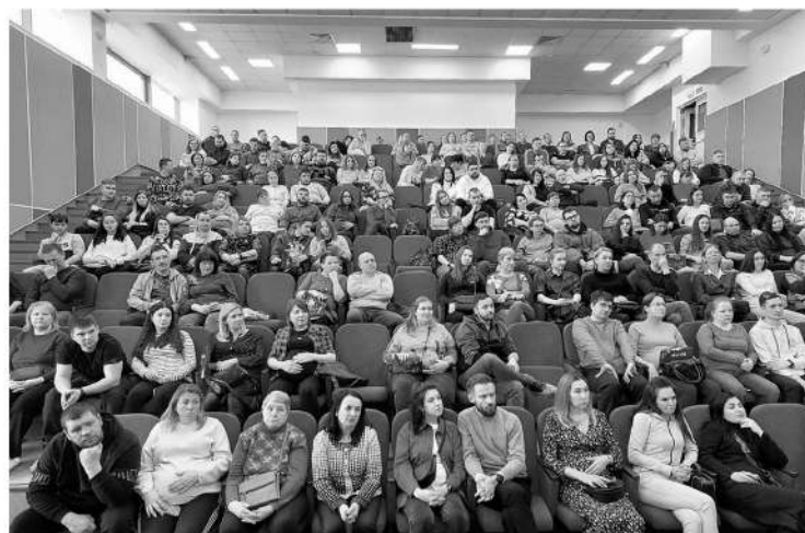
День открытых дверей в Перинатальном центре

В Ленобласти каждая женщина может подготовиться к беременности. Для этого нужно прийти на консультацию к акушеру-гинекологу, он назначит все необходимые исследования, в том числе анализы, позволяющие оценить гормональный статус пациентки. Можно, например, оценить биологический возраст репродуктивной системы женщины, сдать кровь на фолликулостимулирующий гормон (ФСГ) — известный показатель состояния яичников. Важны в этом вопросе и другие маркеры — уровень лютеини-