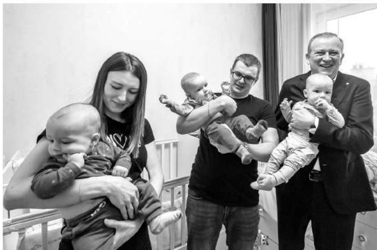
Александр Дрозденко на встрече с многодетными родителями