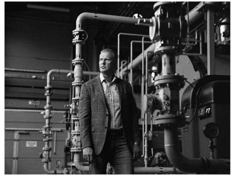
Котельные, построенные Михаилом, работают уже в 7 поселениях

«Энерго-Ресурс» также обеспечивает материалами военные части на территории региона, адресно помогает ветеранам с конкретными проблемами, выделяет средства на подарки для