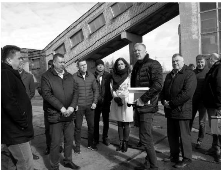
Вместе с братом Владимиром бизнесмен развивает энергетику региона

ТАТЬЯНА ЧУМЕРИНА, ЛИЛИЯ БАТРИШИНА