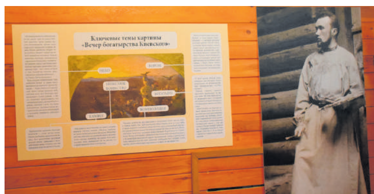
● Таким был Н. Рерих в годы создания картины и пояснительный стенд в выставочном зале