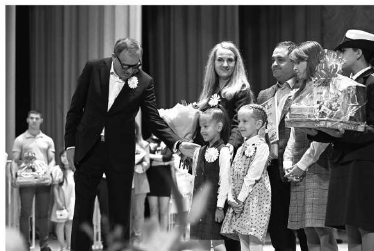
Церемония присвоения звания «Почётная семья Ленинградской области»

В этот день на сцену поднимались не только опытные супружеские пары, но и молодожёны. В рамках празднования Дня семьи, любви и верности в Тосно впервые в истории Ленинград-