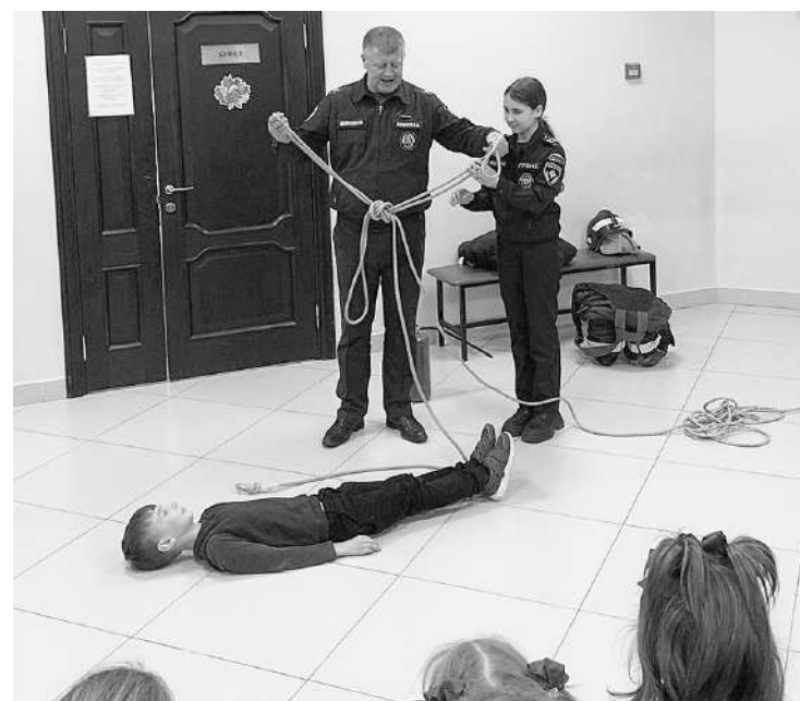
● На занятии по спасению пострадавшего