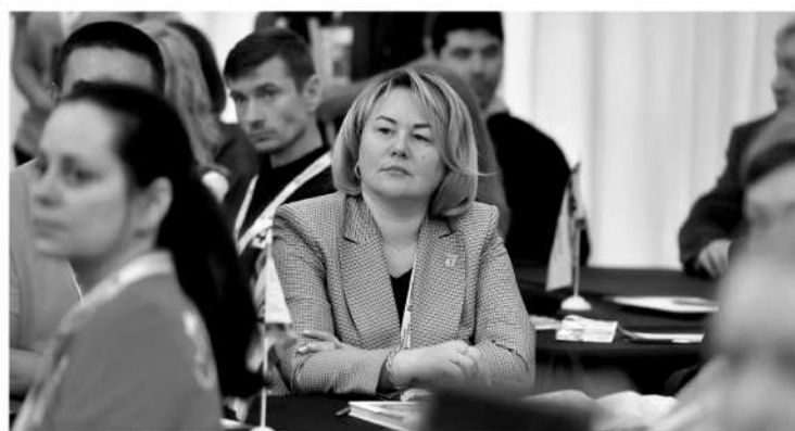
■ Лира Бурак — председатель комитета по местному самоуправлению, межнациональным и межконфессиональным отношениям Ленобласти

— За эти годы благодаря активному участию старост, членов общественных советов и инициативных комиссий создано 10 тысяч очень нужных людям объектов общественной инфраструктуры. Вначале на поддержку инициатив жителей закладывалось 60 млн рублей. Последние годы на 500 инициативных проектов регион выделяет субсидии в сумме 460 млн. И только в 2022 году число жителей, получивших пользу от реализации инициативных предложений, составило более 700 тысяч человек.