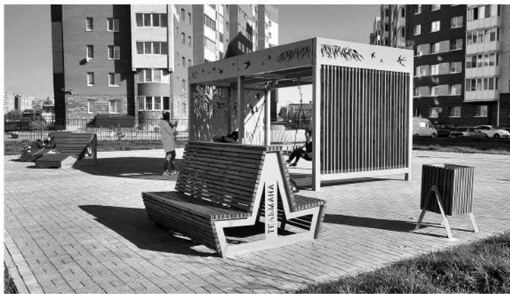
■ Благоустройство набережной Ижоры в посёлке Тельмана по программе инициативного бюджетирования