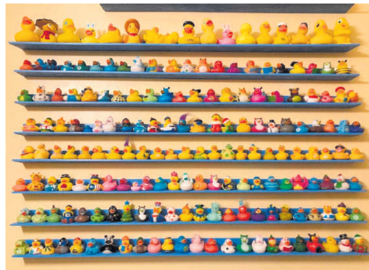
● Коллекция резиновых уток

Между увлечением человека и его внутренним миром существует прямая взаимосвязь. Если человек ощущает (как правило, неосознанно) какую-то внутреннюю пустоту, то вполне вероятно, что он будет пытаться ее заполнить, присваивая элементы внешнего мира (видели, с каким