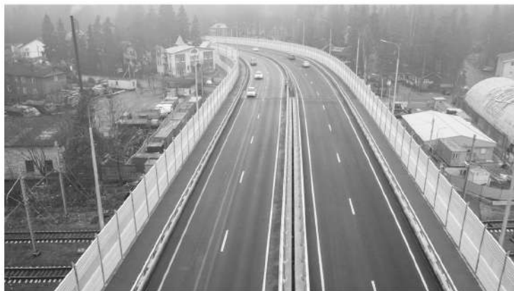
Тротуары на путепроводе во Всеволожске – в цветах города

– Подрядчик работает быстро, область и Минтранс договариваются о предоставлении федеральных субсидий, чтобы мосты строились ещё быстрее. Ориентир по запуску рабочего движения – следующий год. Если говорить о Подпорожье, то уже есть проект второй очереди моста со строительством тоннеля под железной дорогой и выводом транспорта на Мурманское шоссе в обход города.