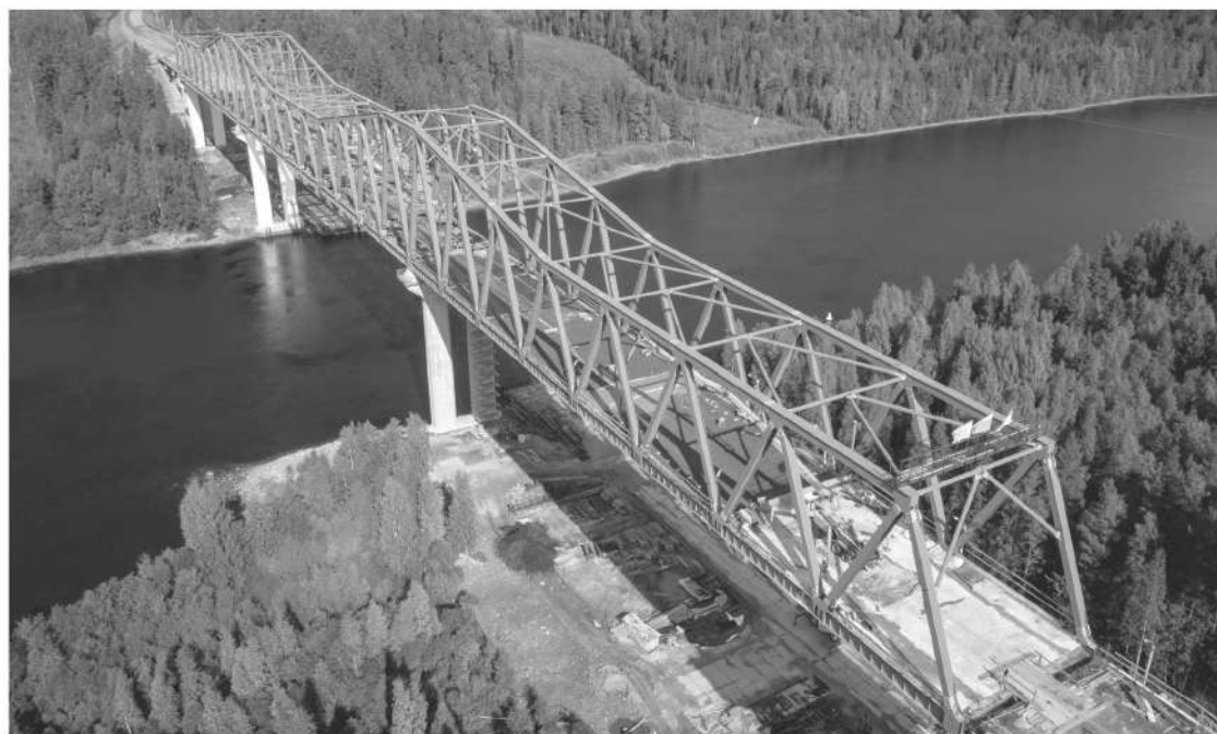
Строительство моста через Свирь идёт с применением технологии литого асфальта