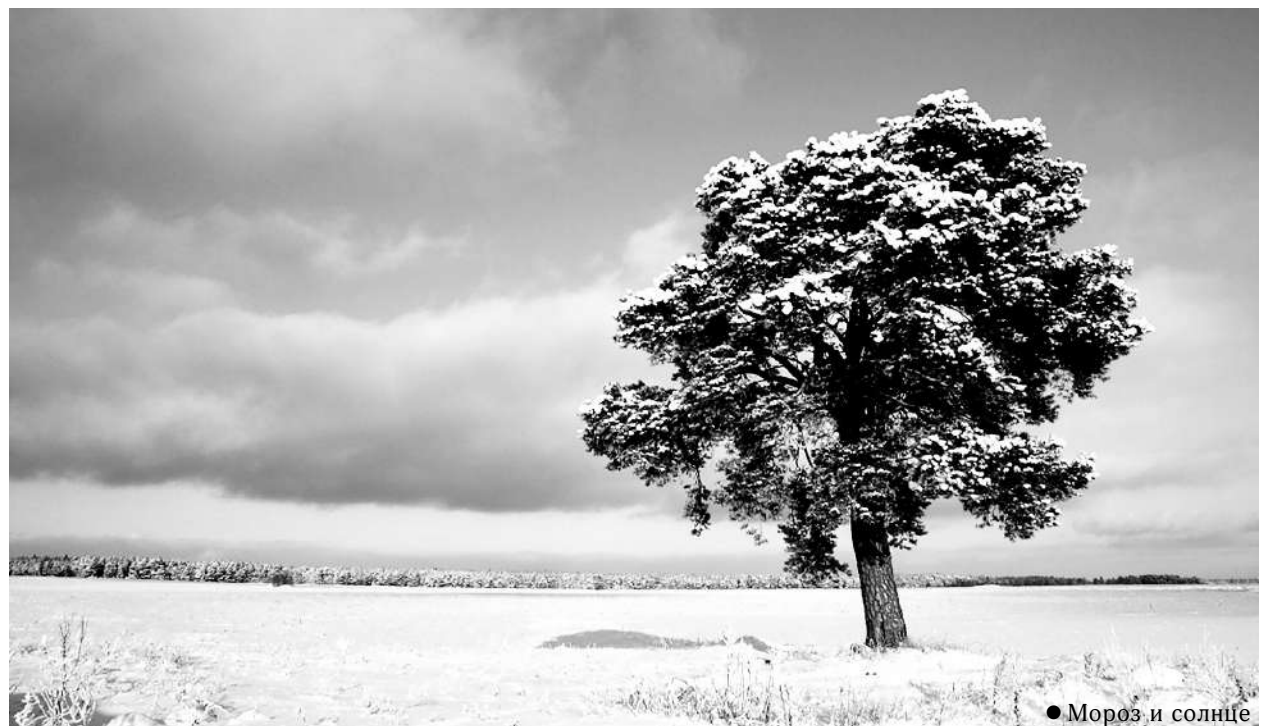
● Мороз и солнце

При себе иметь документы удостоверяющие личность и правоустанавливающие документы на земельный участок.