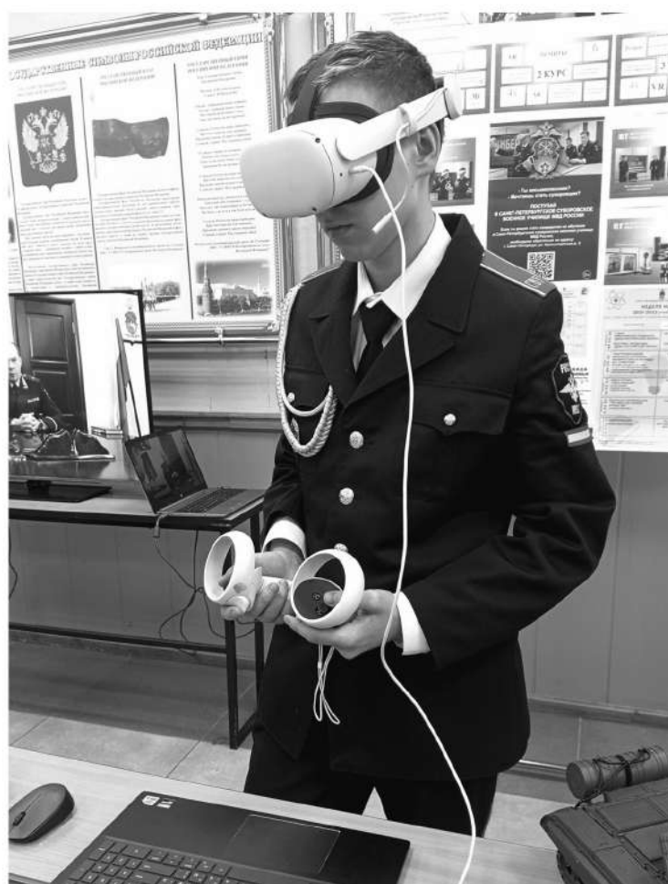
В Суворовском училище кадеты осваивают виртуальную реальность

По его словам, сейчас в военных училищах молодёжь на постоянной основе изучает современные IT-дисциплины. Ведь кибербезопасность стала максимально востребованным и актуальным направлением де-