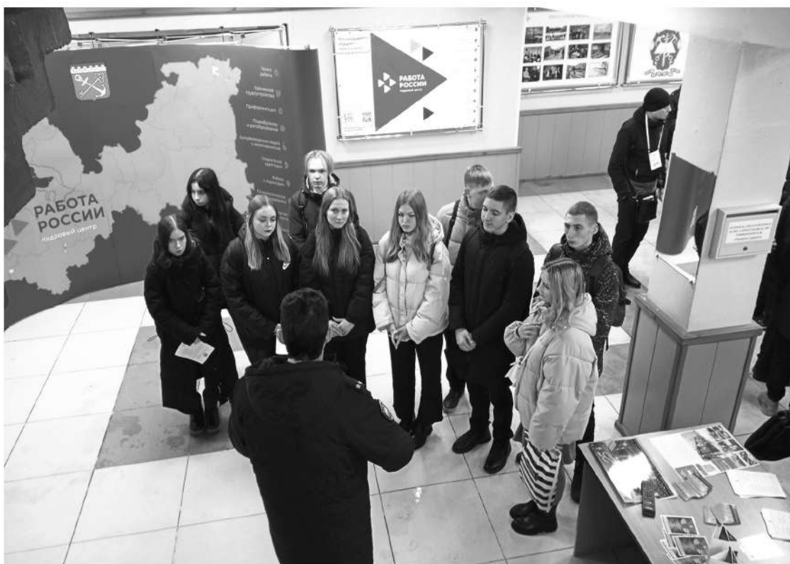
Более 200 школьников приняли участие в ярмарке ведомственных профессий

Ярмарка профессий может стать ярким и неформальным событием — в этом «Ленинградская панорама» убедилась во время посещения учебной базы Университета МВД в Сосново, что под Приозерском. Здесь ленинградским старшеклассникам о своей работе рассказывали представители полиции, спасатели МЧС и эксперты Минобороны.