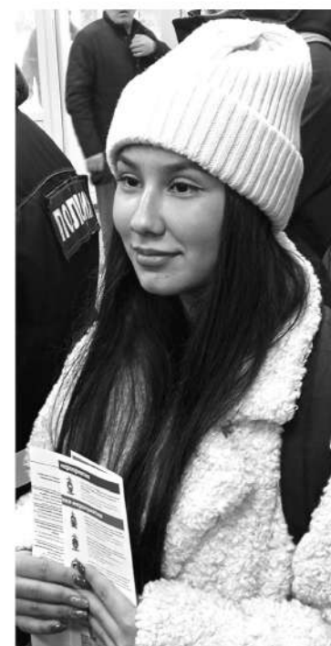
Даже девушек заинтересовала работа в МВД

Так что мошенники из соцсетей и зарубежные хакеры могут потихоньку сворачивать свою деятельность: молодые правоохранители готовы дать им достойный отпор.