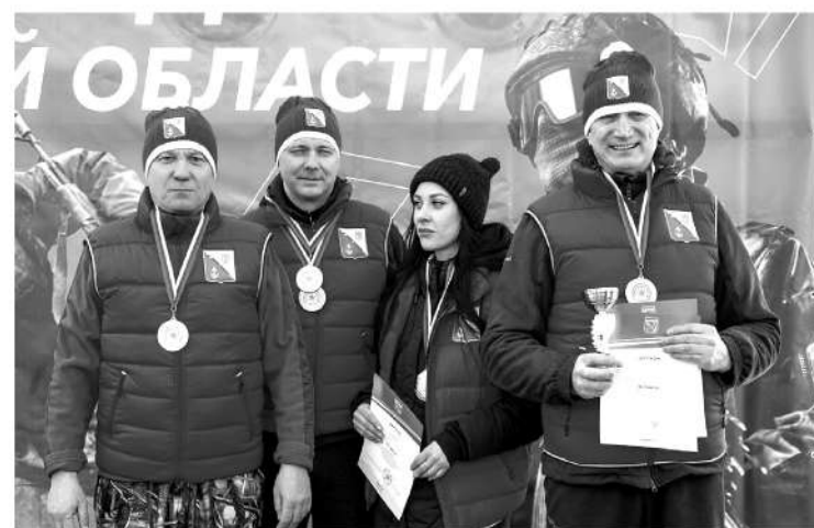
В соревнованиях победила команда Ломоносовского района

— Самым интересным для меня оказалась стрельба. И в це-