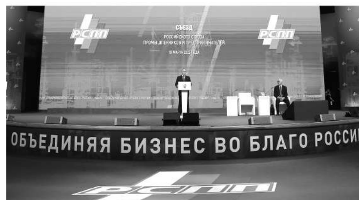
Президент страны ежегодно выступает перед представителями российской промышленности

— Ленинградская область — промышленно развитый регион. И такие регионы страдают подчас от парадоксальных требований! По законодательству сточные воды должны быть чище, чем питьевая вода. На практике это не приводит к тому, что внешняя среда становится чище: стоки всё равно замешиваются с канализационными водами. А сумма штрафов для предприя-