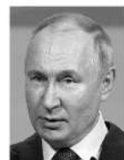
ВЛАДИМИР ПУТИН, ПРЕЗИДЕНТ РОССИЙСКОЙ ФЕДЕРАЦИИ

Государство, безусловно, будет всячески поддерживать ответственный бизнес, тех, кто готов бороться и за своё дело и за благополучие своих коллективов, людей, которые у вас работают, за благополучие всех граждан России.