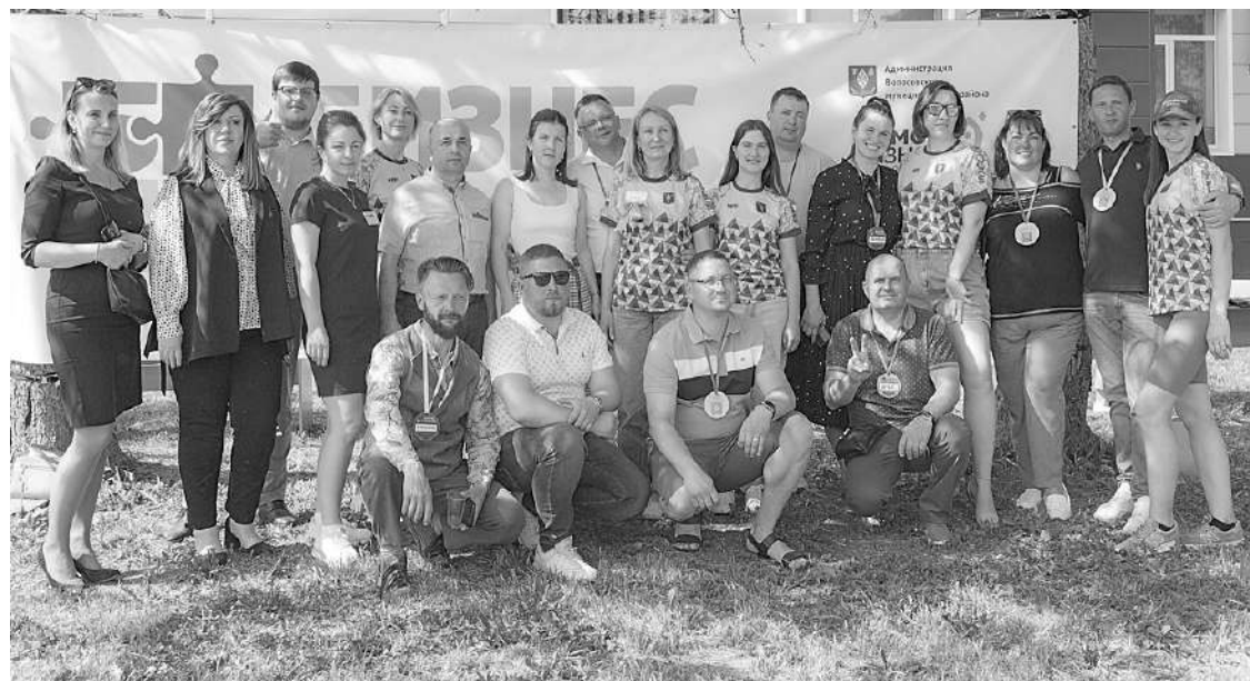
● Бизнес-пикник 2023

*По данным на 01.04.2024, АНО «Волосовский ЦПП» оказал субъектам малого и среднего предпринимательства, самозанятым и гражданам