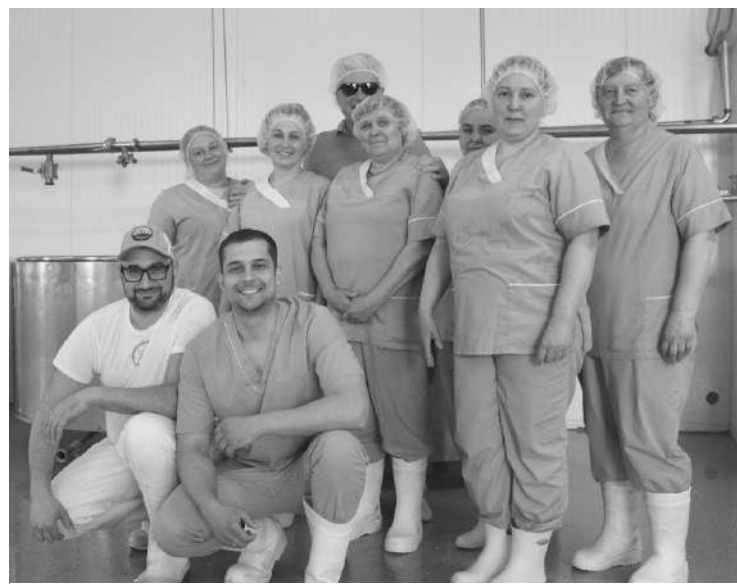
● Коллектив «Сырмарки»

ют в собственной лаборатории, и только потом оно поступает в пастеризатор и путешествует дальше по производственной цепочке. «Сырмарка» предъявляет высокие требования и к воде: ее здесь умягчают и многоступенчато очищают от разных примесей. Качественное сырье — залог того, что моцарелла, буратта и другие сыры из Сумино — не аналог итальянского сыра, а точно такой, как в Италии.