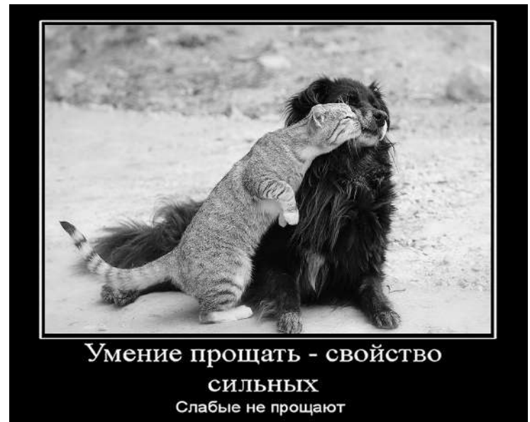
Умение прощать - свойство сильных Слабые не прощают

В речевой практике «извини» и «прости» зачастую сближаются. Но лишь в тех случаях, когда используются для