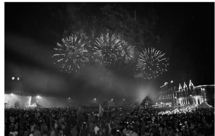
Концерт и салют на Рыночной площади завершили программу праздника