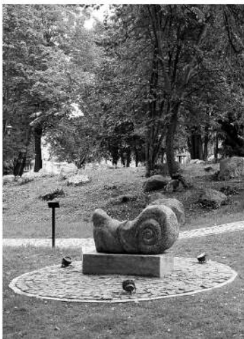
Сад скульптур после благоустройства

Выборгский замок и башня Святого Олафа, Рыночная площадь и Дом бургера — эти памятники средневековья знакомы каждому, кто хотя бы раз бывал в Выборге. Однако за последние годы в старинном городе появилось немало новых достопримечательностей, каждая из которых могла бы стать его полноценной визитной карточкой. Празднование Дня Выборга