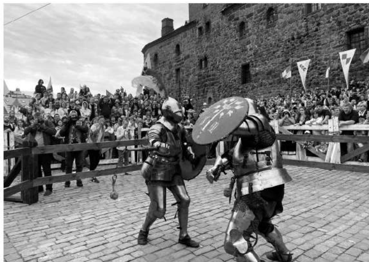
Рыцарский турнир в Выборге проходил в традициях XV века

Сами скульптуры появились здесь в 1988 году — тогда в Выборге проходил тематический художественный симпозиум. Лучшие мастера со всей страны подарили древнему городу свои работы в жанре гранитной парковой скульптуры. «Поющий камень», «Орфей», «Улитана», «Волк» — эти загадочные фигуры, вы-