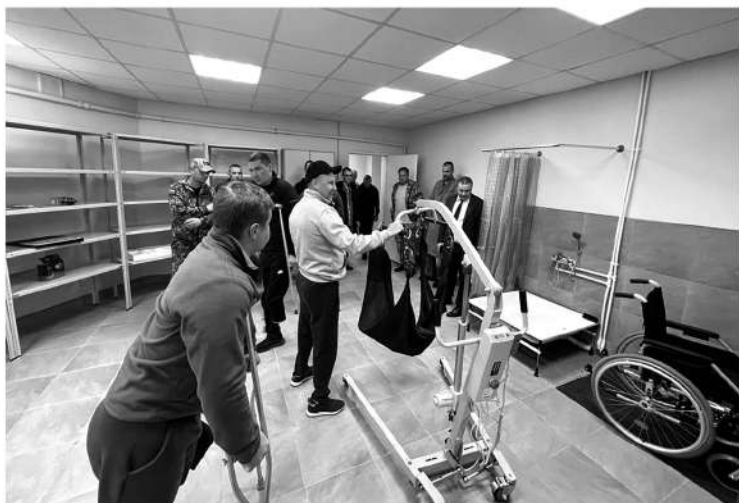
Ветеранов СВО обеспечивают средствами технической реабилитации

Список льгот и мер поддержки для участников СВО и членов их семей в Ленинградской области продолжает пополняться. По состоянию на август 2023 года он состоит из 59 пунктов — столь крупного и детально проработанного комплекса мер нет ни в одном другом регионе России. «Ленинградская панорама» узнала у представителей комитета по социальной защите населения Ленобласти о новых льготах для наших защитников и темпах оказания помощи ветеранам СВО.