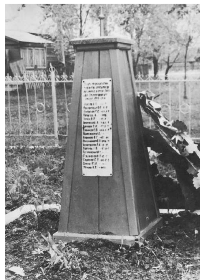
● Деревянный памятник на могиле танкистов 30-й гв. танковой бригады.

Перерезав дорогу Марковка-Волосово, его взвод в 23.00 ворвался на ст. Волосово с северо-запада. Через полчаса боя второй танк разведывательного взвода был подбит и загорелся. Командир танка мл. лейтенант