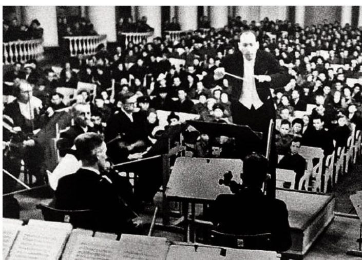
• Премьера симфонии в блокадном Ленинграде.