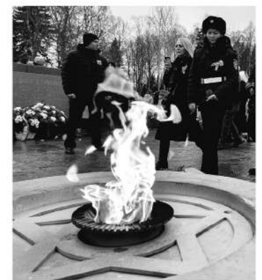
Годом ранее страна отмечала юбилей прорыва блокады

Командование союзных войск также восприняло эту победу