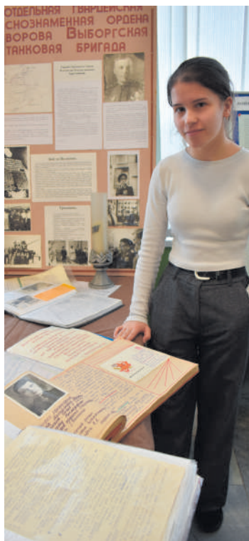
• Ученица ВСОШ №1 на выставке