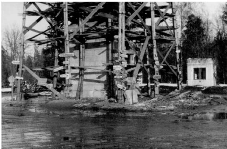
Коннетабль в Гатчине в годы немецкой оккупации

БЕСЕДОВАЛ СТАС БУТЕНКО