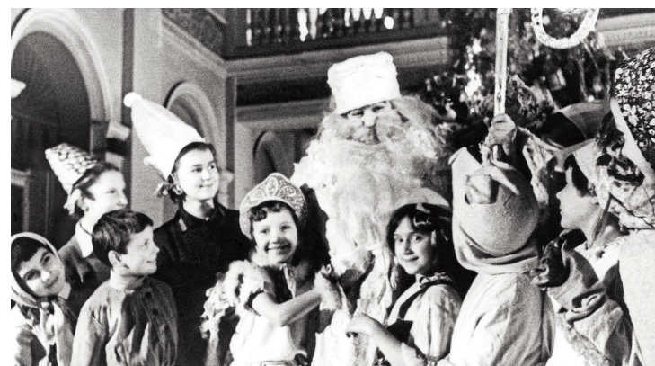
• Елка в Доме пионеров и школьников при Дворце культуры имени Кирова в дни блокады.

На фото: Елка в Доме пионеров и школьников при Дворце культуры имени Кирова в дни блокады.