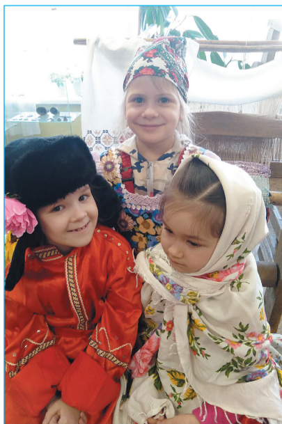
Подготовила Н. БОГДАНОВА

Идея музейных уроков для детей разных возрастов принадлежит заведующей Сабским историко-краеведческим музеем Л. Фетисовой 47