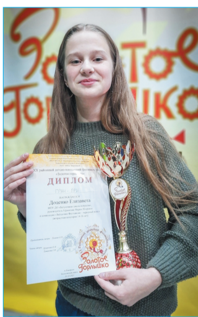
XXI детско-юношеском Фестивале песни "Золотое горлышко" 47 С. Гонторенко Подготовила Н. БОГДАНОВА

В следующем году ждем новых талантливых исполнителей на