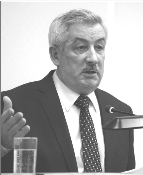
Уважаемые жители Волосовского района! Уважаемые депутаты, руководители предприятий и коллеги!

Рад приветствовать вас на ежегодном собрании, посвященном подведению итогов социального и экономического развития Волосовского района за 2020 год и задачам, которые поставлены перед органами местного самоуправления на 2021 год. Особое внимание уделю вопросам здравоохранения, повышению комфортности жизни населения и экологии. Нам пришлось решать все эти задачи в сложных, неординарных условиях, с которыми мы в новейшей истории еще не сталкивались.