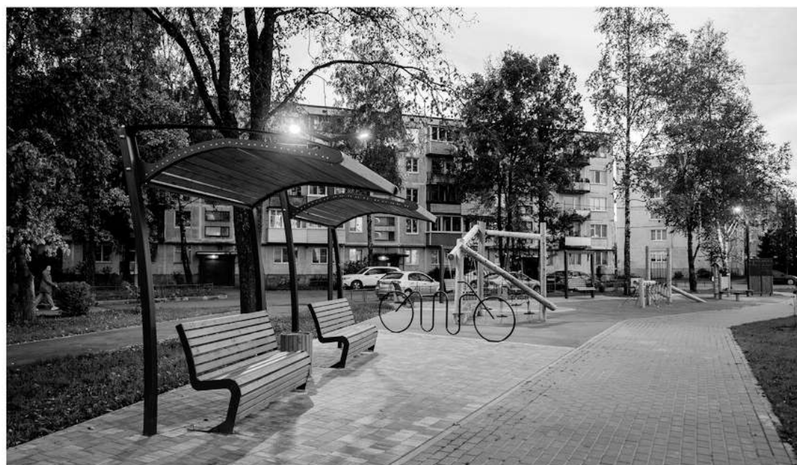
Общественное пространство в Пудомьягах вошло в список лучших объектов благоустройства Минстроя РФ

ленинградцы на региональной платформе в онлайн-формате выбрали места для проведения работ, а теперь проектировщики и архитекторы готовят проекты с учётом обсуждений на сессиях соучаствующего проектирования. Слышать жителей и учитывать их мнение — очень важно, потому что именно им там жить, отдыхать, проводить время с родными и близкими, —