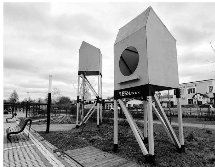
Птичья площадь в посёлке Лебяжье

Свою активную гражданскую позицию жители Ленинградской области могут проявить не только на проектировочных сессиях. В рамках нацпроекта «Жильё и городская среда» до 30 апреля на единой федеральной платформе 47.gorodsreda.ru проходит голосование по выбо-