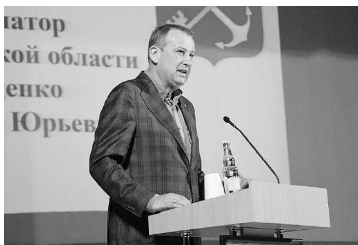
Материал 3 и 4-й страниц подготовила Н. БОГДАНОВА.

- Невозможно работать чиновником, не неся ответственности. Вы для себя поймите, что мы под увеличительным стеклом. Нас за каждый наш шаг будут проверять, но