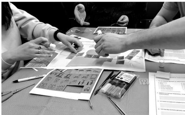
На проектировочной сессии жители посёлка могли выбрать наполнение проекта благоустройства

— Встречаемся и общаемся с жителями небольших населённых пунктов, где в 2025 году по президентскому нацпроекту «Жильё и городская среда» планируется благоустройство общественных территорий. Сначала