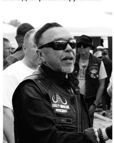
Гарик Сукачёв на патриотическом мото

К слову, вопреки всем санкциям, фестиваль сохранил международный статус. Мы, например, пообщались с байкером из Казахстана Дмитрием Петрухиным.