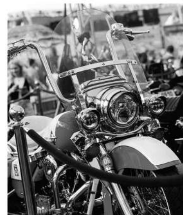
Традиционная выставка ретро-байков

Причём патриотизм — это широкое понятие. Патриотизм — это и любовь к Родине. Кроме того, патриотизм — это пропаганда красоты нашей страны, здорового образа жизни. А байкер — это всё-таки здоровый образ жизни. У нас есть свои принципы. Мы не нарушаем правила. Мы вежливы на трассе. Мы помогаем тем, кто на трассе попал в беду. А самое главное — мы пропагандируем то, что в путешествии ты узнаёшь свою страну. И, конечно, для нас сегодня патриотизм — это поддержка наших ребят в зоне Специальной военной операции. И мы все уверены в нашей Победе.