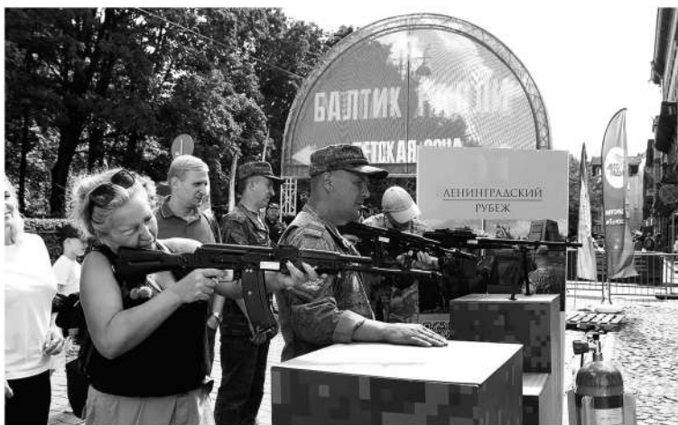
Стенд фонда «Ленинградский рубеж» пользовался популярностью у молодёжи