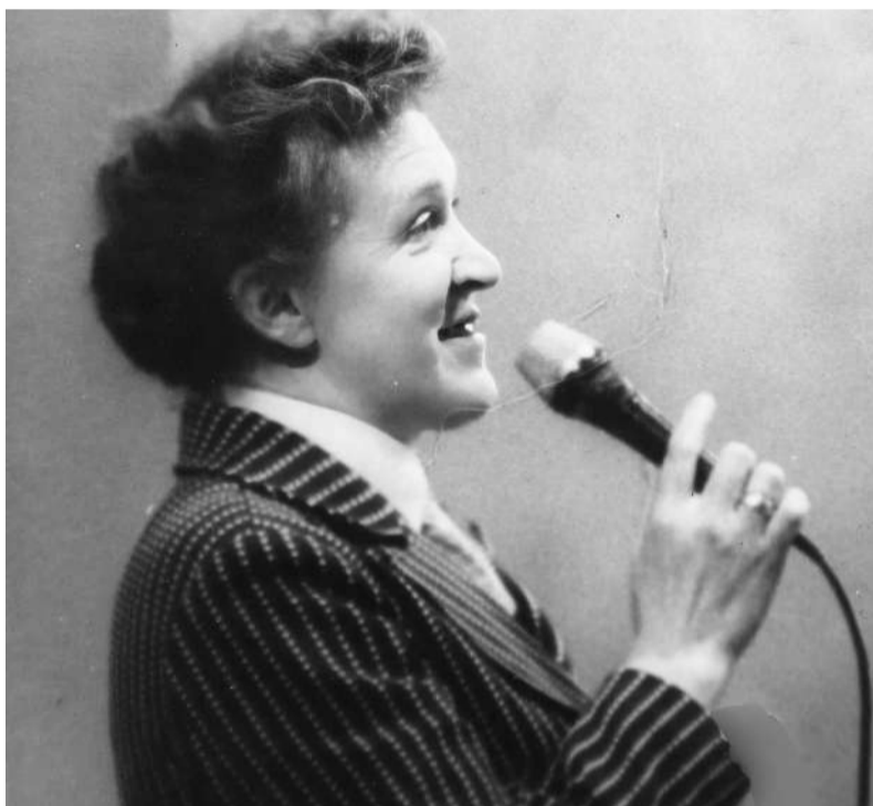
● Директор Бегуницкой школы