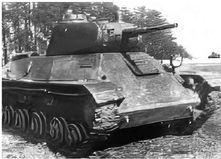
● Один из легких танков Т-50, находившихся под командованием Хрустицкого