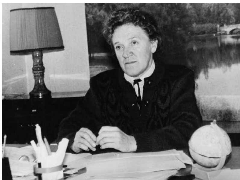
● Директор Волосовской школы №1