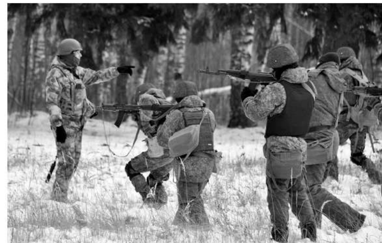
В Лужском районе бойцы проходят боевое слаживание перед отправкой на фронт