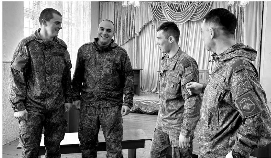
Дух боевого братства ветераны СВО сохранили и по возвращении с фронта

Бобёр любит повторять: «На передовой не страшно толь-