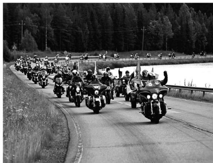
Мотоколонна проехала по Выборгскому району до границы с Финляндией

Действительно, ленинградцы охотно подходили к байкерам, фотографировались с их мотоциклами, кому-то даже раз-