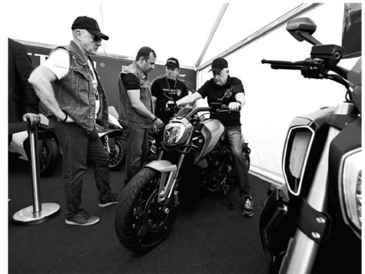
Губернатор Александр Дрозденко поддерживает «Балтик Ралли» со дня основания

Для гостей города были организованы пешеходные экскурсии от местных краеведов, детей ждали конкурсы и мастер-классы. Особенно понравился детворе подвижный арт-объект: гигантский мото-