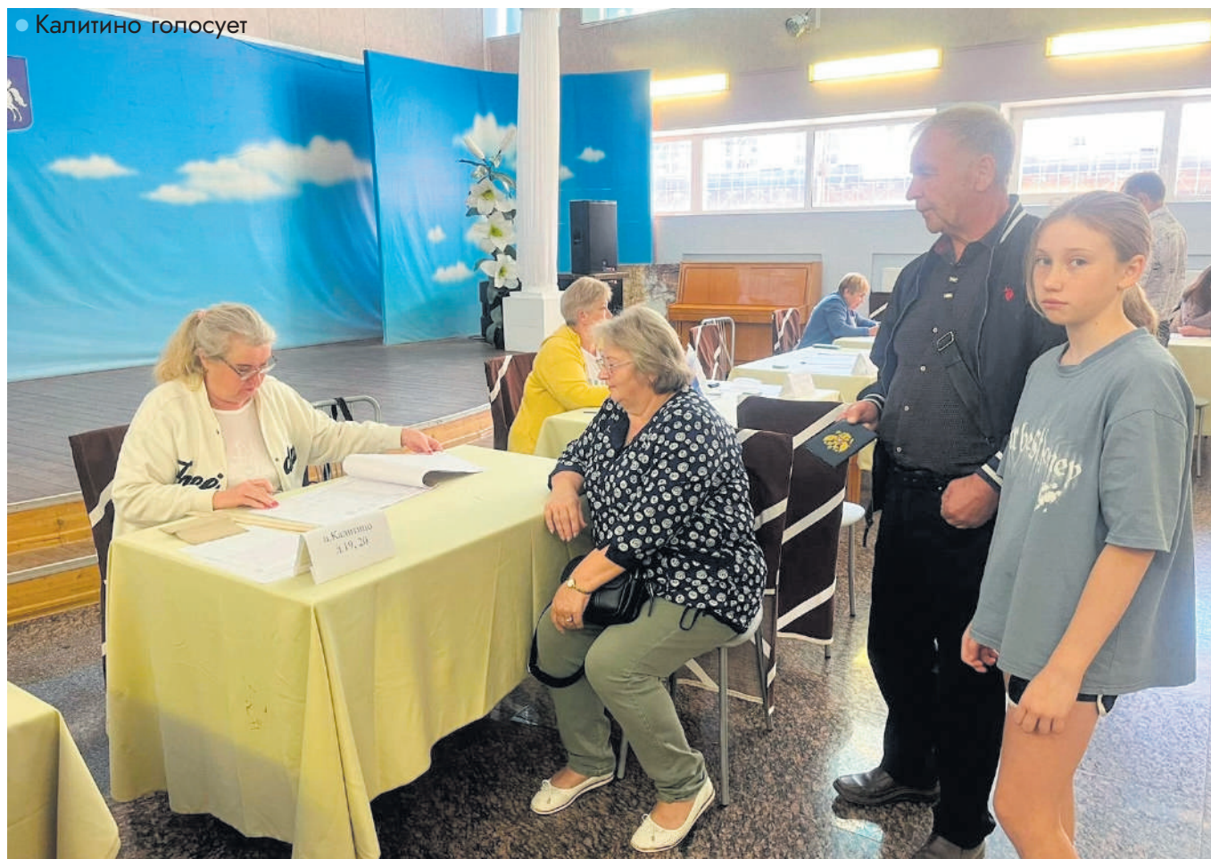
• Калитино голосует

В целом по итогам выборов замещены 76 депутатских мандатов. Из общего числа: кандидаты политической партии «Единая Россия» — 72, от партии «Справедливая Россия — За правду» — 2, от партии ЛДПР — 1, выдвинутый в порядке самовыдвижения — 1.