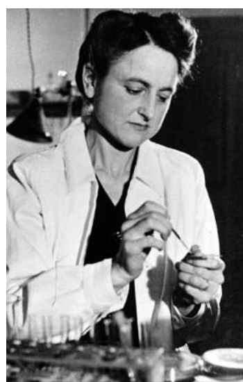
● З. Ермольева

запас его быстро иссяк. Болезнь возобновилась, и пациент умер. Несмотря на это наука торжествовала, так как было убедительно доказано, что пенициллин прекрасно действует против заражения крови. Через несколько месяцев ученым удалось накопить такое количество пеницилина, которого могло хватить для спасения человеческой жизни. Счастливец был пятнадцатилетний мальчик с заражением крови, которое не поддавалось лечению. Это был первый человек, которому пенициллин спас жизнь.