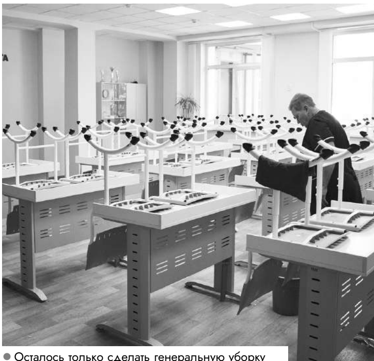
● Осталось только сделать генеральную уборку

Школа сияет чистотой и порядком: 1 сентября учеников и педагогов надо встре-