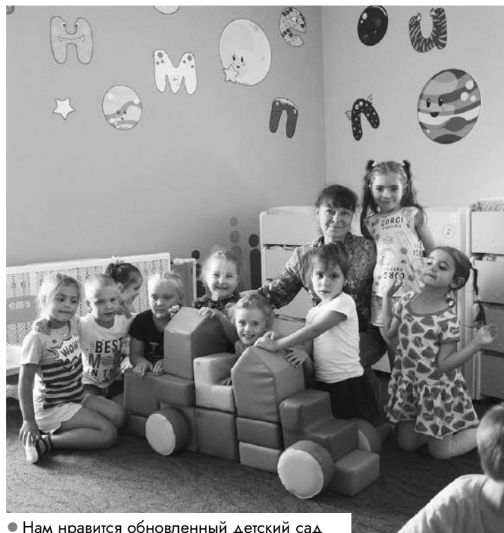
● Нам нравится обновленный детский сад

Малышам сюда приходиться в радость, потому что столько всякого интересного и разнообразного, познавательного и развивающего ждет их здесь! А родители, несомненно, испытывают гордость, что в поселке теперь такой детский сад – красивый, с уникальным дизайнерским интерьером и многофункциональностью всего пространства.