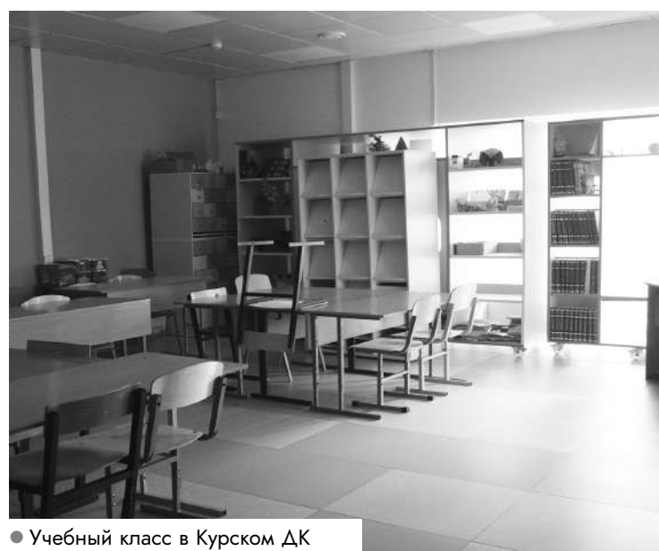
● Учебный класс в Курском ДК

А пока школьники учатся в помещениях детского сада и местного Дома культуры. И торжество по случаю начала нового учебного года будет проходить на площади возле