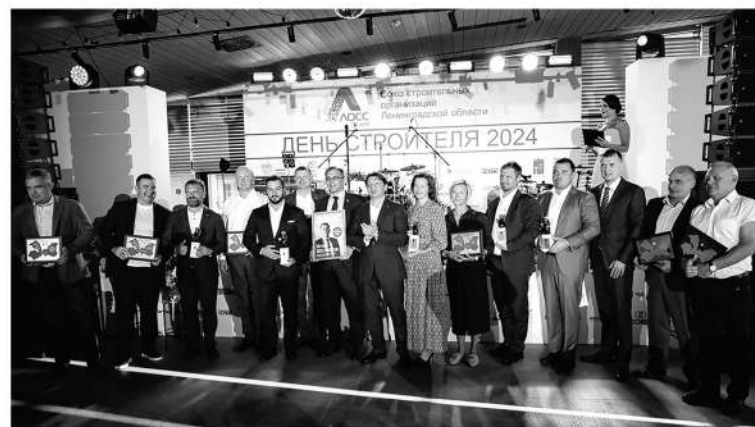
Церемония награждения лучших застройщиков 47-го региона

— Это видно невооружённым взглядом. Достаточно посмотреть на стройки и проанализировать цифры. Сейчас регион постепенно отходит от строительства «миниатюрных» квартир. Согласно постановлению, подписанному губернатором, жилпло-