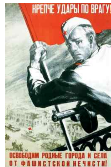
❖ Армейский плакат военных лет

По материалам Российского государственного архива литературы и искусства (РГАЛИ)