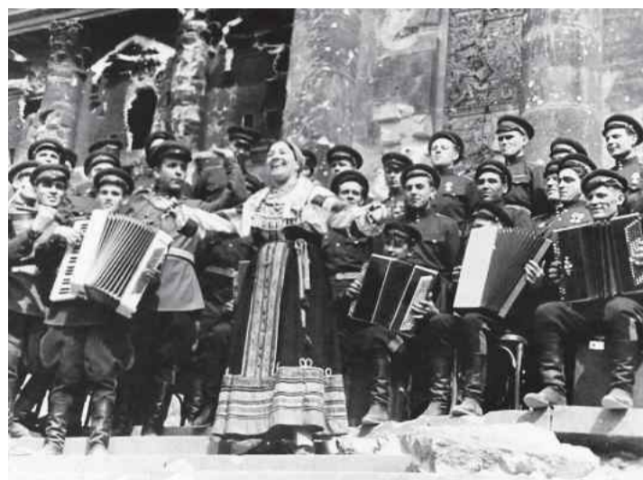
❖ Лидия Русланова у стен Рейхстага

Вопрос о том, концерт какого артиста или какой фронтовой бригады, вошедшей в Берлин с советскими войсками, состоявший первым, долго занимал историков и журналистов. Одни считали, что эта честь принадлежит артистам Большого театра, другие называли имя Лидии Руслановой. Эти споры не утихают до сих пор, и едва ли когда-то ответ будет найден.