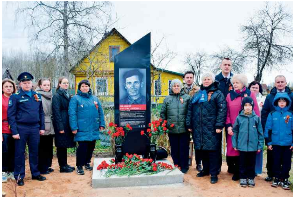
❖ Почетные участники церемонии с многочисленными родственниками героя