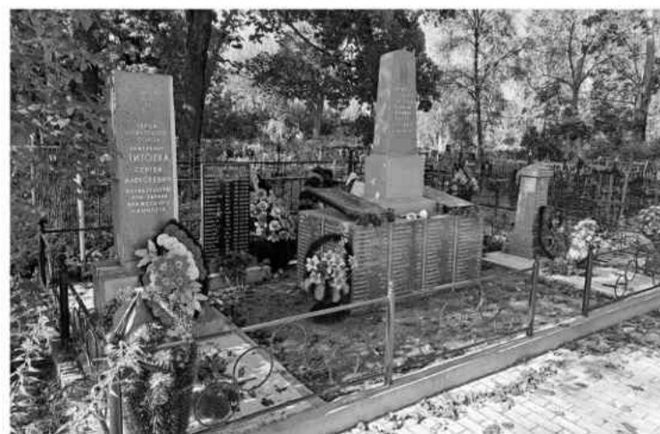
Могила Героя Советского Союза лётчика С.А. Титовки