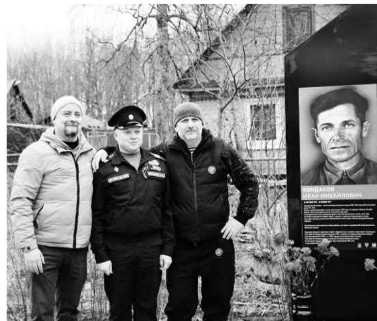
❖ Правнуки героя