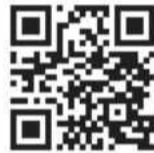
График выездов специалистов ЛОГАУ «Мультипротез»

в индивидуальную программу реабилитации и абилитации, оформления медико-технического заключения, составления индивидуального плана протезирования.