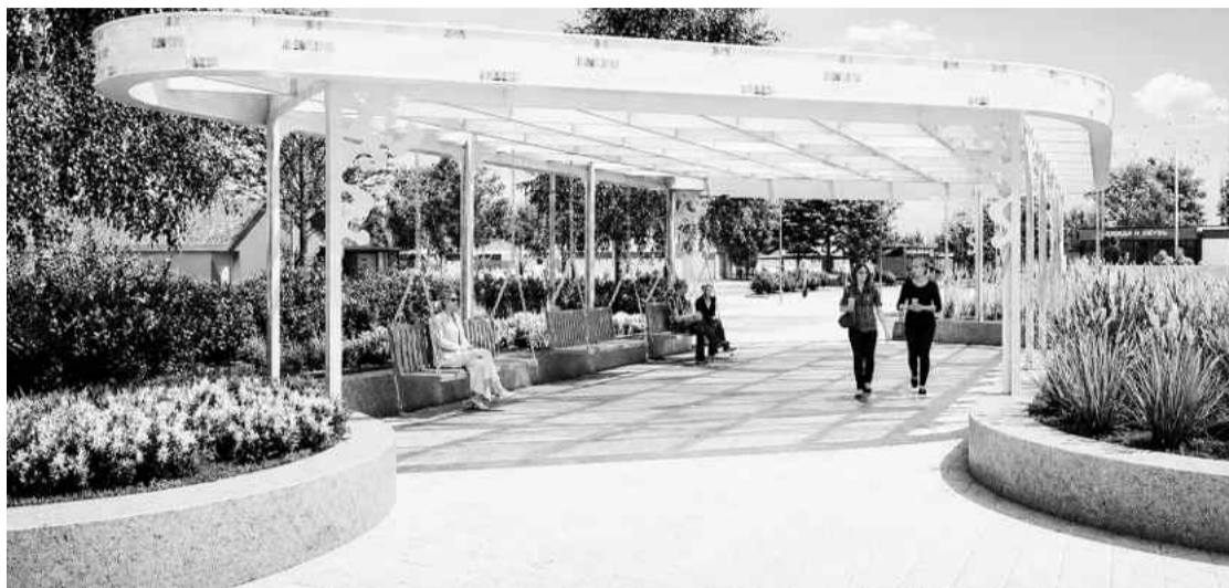
❖ Такой будет зона отдыха на площади перед ГДЦ «Родник»

Цветной навес с качелями, украшенный фарфо-