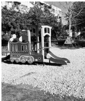
❖ Благоустройство в Сабске

За счет средств иных межбюджетных трансфертов на поддержку муниципальных образований Ленинградской области по развитию общественной инфраструктуры муниципального значения в Ленинградской области были приобретены и установлены спортивные тренажеры в д. Лемовжа на 368 тыс. рублей ; детский городок у д. 12 в д. Большой Сабск на 526 тыс. рублей .