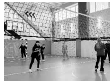
❖ В обновленном спортзале

В 2025 году Волосовская районная общественная организация по развитию местных сообществ «Хлебное место» реализовала проект «Совместно» на территории деревни Большой Сабск. В его рамках было проведено социологическое исследование, в котором приняли участие 344 жителя деревни в возрасте от 15 до 80 лет. Благодаря анкетированию, стали понятнее наиболее острые проблемы территории, а также степень готовности жителей принимать участие в решении этих проблем. Заключительным этапом реализации проекта стало проведение в деревне мероприятия «Круг благотворителей». Наиболее активные жители Большого Сабска представили свои проекты по улучшению инфраструктуры деревни местным благотворителям и смогли собрать 168.500 рублей на реализацию своих инициатив: велопарковку у Дома культуры и информационный стенд на мемориале.