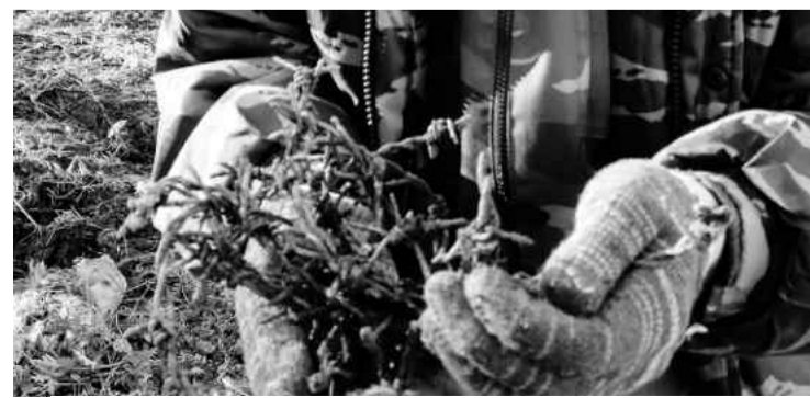
❖ Колючая проволока с места находки