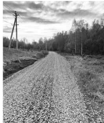
❖ Отсыпка дороги щебнем

В 2025 году за Сабским сельским поселением было признано право собственности на бесхозяйное имущество в виде дорог протяженностью 4 км 619 м . На 01.01.2026 года протяженность дорог местного значения составила 53 км 497 м .