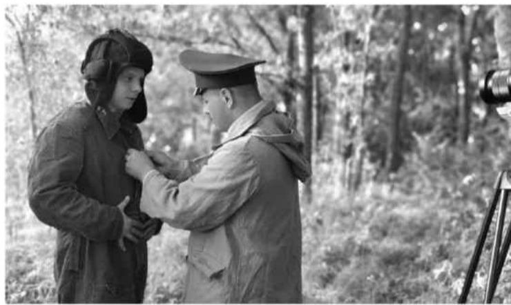
Фото со съёмок фильма «Война и мир лесничего Антипова»

АЛЕКСАНДРА СИДОРОВА