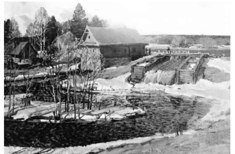
❖ Весна на старой мельнице. Картон, масло. 50x79,5 1977 год. д. Чёрное, Волоsovский район