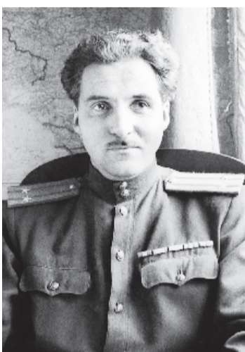
◆ Константин Симонов

«Жди меня» называют лучшим стихотворением Великой Отечественной. Его учили наизусть, переписывали, посылали с тыла на фронт и с фронта в тыл