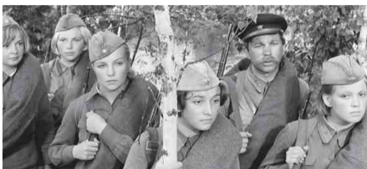
❖ «А зори здесь тихие»

стве любимого фильма о войне россиянки также чаще назвали ленту «Офицеры». Мужчины же чаще выбирали «Они сражались за Родину» (14% против 8% среди женщин), «Освобождение», «Иди и смотри» — подвели итог аналитики.