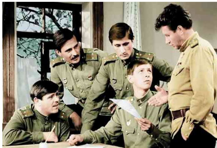
❖ «В бой идут одни «старики»

Еще 15% участников опроса назвали другие фильмы — как российские, так и зарубежные. Четыре процента респондентов заявили, что хороших картин о войне слишком много, чтобы выбрать одну. Совсем не смотрят воен-