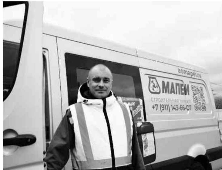
❖ И. Харионовский

Как рассказал директор, на предприятии трудятся 20 человек – все местные жите-