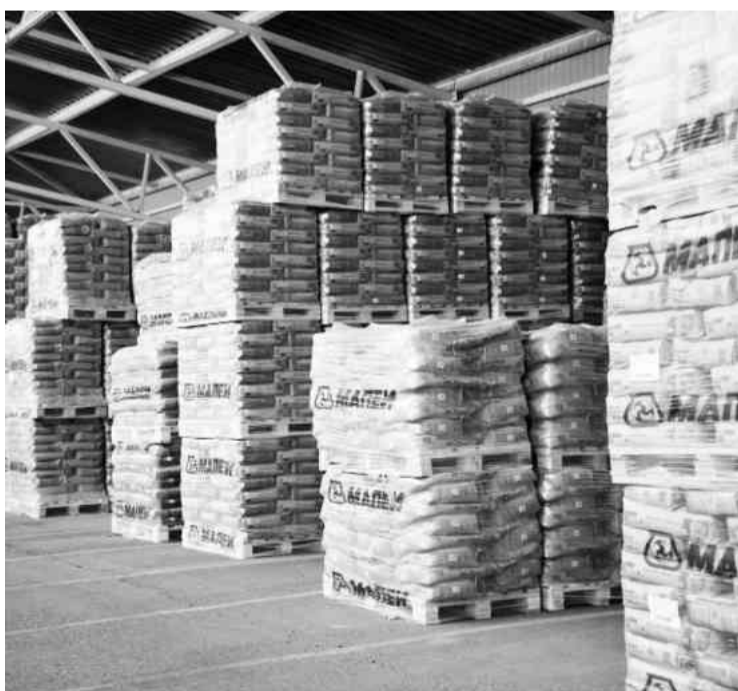
❖ На складе готовой продукции

Действуя на территории Калитинского сельского поселения, МАПЕИ поддерживает связь с администрацией муниципального образования. В частности, выделяет средства на чествование ветеранов 9 Мая, откликается на другие просьбы, связанные с местными делами.