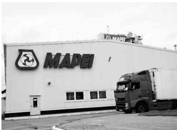
❖ Территория предприятия

- Мы расширяем наше присутствие в регионе и продолжаем следовать традициям и принципам, которые включают в себя честность, лояльность, порядочность, уважение и репутацию, - подчеркивает руководитель.