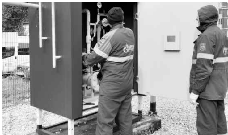
❖ Запуск в эксплуатацию распределительного газопровода в Кикерино

В 2025 году 106 обучающихся получили профессии «Вожатый», «Повар», «Рабочий зелёного хозяйства», «Животновод», «Ассистент экскурсовода», «Цифровой куратор». Профессия со школьной скамьи — реальность! На базе школ Волосовской №2 и Изварской функционируют кадетские классы и медицинский предпрофильный класс - в Сельцовской школе. А с 1 сентября 2025 года открыт медицинский класс в Волосовской школе № 1. Теперь у школьников ещё больше возможностей попробовать себя в будущей профессии.