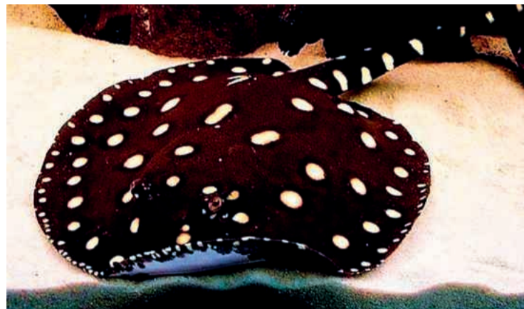
♦ Скот Леопольди

У арованы есть всё, что любит дорогой коллекционный рынок. Она крупная, эффектная, заметная и требует большого аквариума. Это не та рыба, которую можно держать «между делом». Арована выглядит необычно: длинное тело, круп-