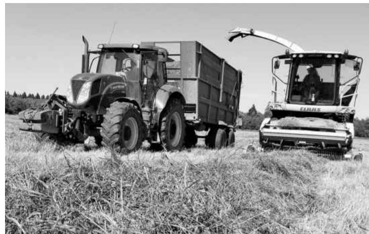
❖ Заготовка кормов в «Каложицах»

На этом фоне особенно заметна положительная динамика доходов населения. Среднемесячная заработная плата работников выросла на 22%, достигнув 83 977 рублей. При том, что среднегодовой рост цен в Ленинградской области составил 9,4%, реальный рост доходов населения очевиден: заработная плата уверенно опережает рост цен, что свидетельствует о повышении благосостояния жителей района. Тем не менее уровень оплаты труда в Волосовском районе остается на четверть ниже среднеобластного показателя – по области средняя зарплата составляет 109 256 рублей. Это объясняется структурными особенностями местной экономики: в районе отсутствуют