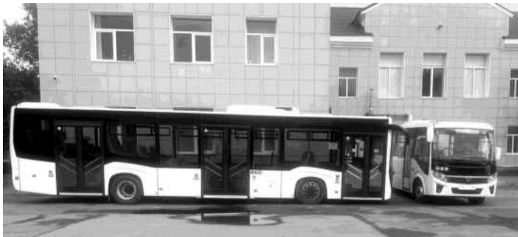
❖ Автобусы, приобретенные администрацией района для улучшения качества пассажирских перевозок

Администрация Волосовского муниципального района в июле 2025 года за счёт средств местного бюджета приобрела два автобуса, полностью соответствующих требованиям доступности для инвалидов (в том числе наличие подъёмных платформ/аппарелей, поручней, мест для инвалидных колясок, кнопок вызова водителя и пр.). Данные автобусы переданы в пользование перевозчику, обслуживающему маршруты на территории Волосовского района.