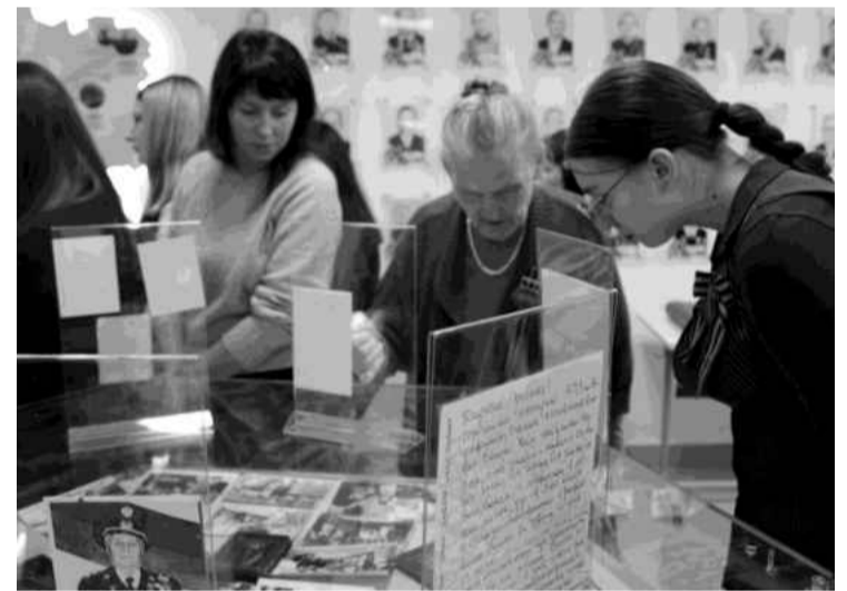
❖ Музей Сельцовской школы

В отчётном году на территории Волосовского муниципального района были проведены комплексные кадастровые работы федерального значения в отношении 28 кварталов в Калитинском поселении, семи - в Раби-