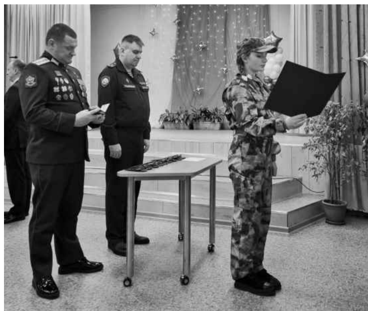
❖ Открытие кадетского класса Росгвардии в Изварской школе

Полный текст доклада главы администрации Волосовского района читайте на нашем сайте. Включите камеру смартфона, наведите её на QR-код, перейдите по появившейся ссылке.