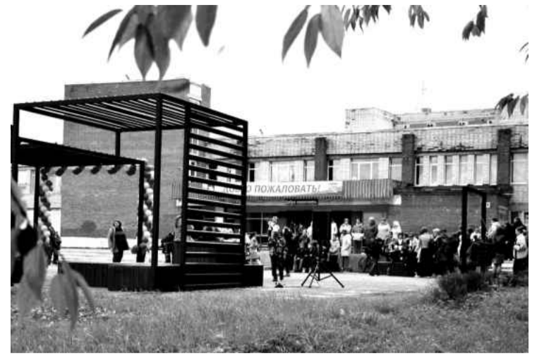
❖ Открытие общественного пространства возле ДК «Калитино»

В январе 2026 года Ленинградская область сделала важный шаг в борьбе с борщевиком Сосновского — анонсирован запуск мобильного приложения на цифровой платформе региона «Цифра 47». Новый сервис задуман как удобный и эффективный инструмент вовлечения жителей в решение общей экологической проблемы. С его помощью каждый сможет оперативно сообщать о новых очагах распространения опасного растения, просто отметив их на карте. С другой стороны, профильные ведомства и подрядные организации получат возможность публиковать в приложении информацию о запланированных и уже выполненных работах по обработке территорий. Это обеспечит полную