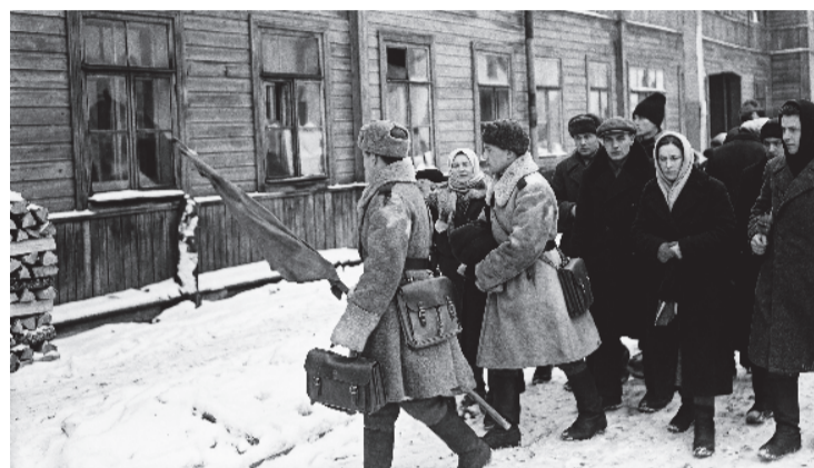
(Кадр кинохроники отреставрирован с помощью ИИ)

На снимке: митинг в честь освобождения Волосово. 27 января 1944 года.