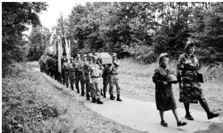
Перезахоронение в Зимитицах