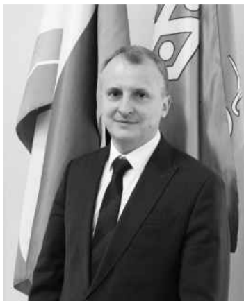
Уважаемые жители Волосовского района! Уважаемые депутаты, руководители предприятий и коллеги!

Сегодня я хочу поделиться с вами итогами социально-экономического развития Волосовского района за 2025 год и задачами, которые поставлены перед нами на текущий год и ближайшую перспективу.