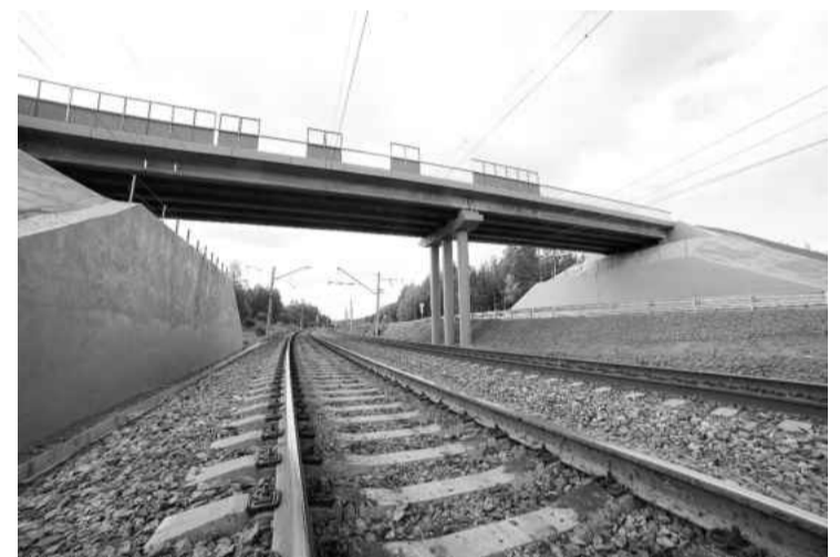
❖ В 2026 году планируется начало строительства путепровода

Отдельного внимания заслуживает проект, имеющий стра-